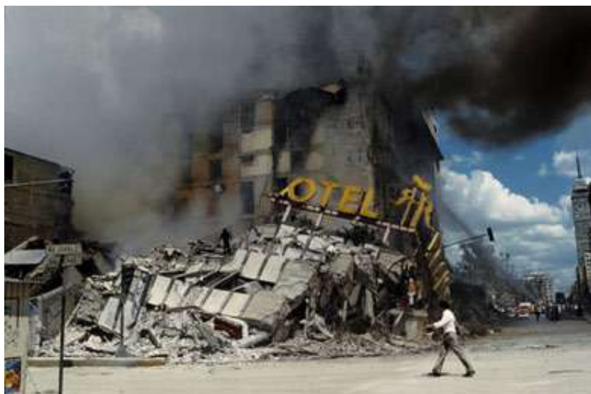
Izquierda, «Ciudad de México, 19 de septiembre de 1985. Hotel Regis en el centro de la ciudad tras el terremoto de 1985.». Derecha, «Ciudad de México, 1968. Un niño en su bicicleta, de alrededor 12 años de edad, muere al ser atropellado por un coche en la Avenida Alvaro Obregón».