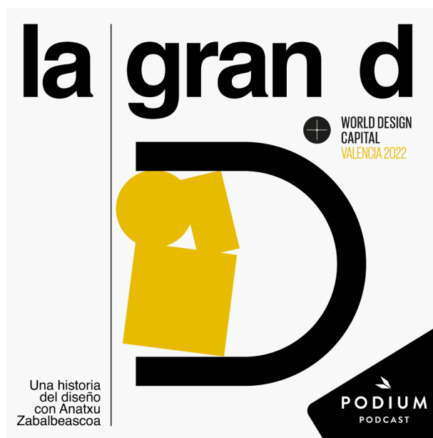
Figura 6: Portada del pódcast La Gran D . https://www.podiumpodcast.com/podcasts/la-gran-d-podium-os/

posibilidades que ofrecen los medios de difusión en el siglo XXI. Una de sus piezas clave fue la obra de Sidonie Smith, Manifiesto for the Humanities: Transforming Doctoral Education in Good Enough Times (2015), en el que defiende que existen otras formas de afrontar la producción de los resultados de la investigación académica.