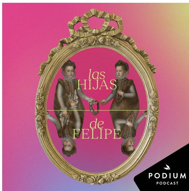
Figura 8: Portada del pódcast Las Hijas de Felipe . https://www.podiumpodcast.com/podcasts/las-hijas-de-felipe-podium-os/