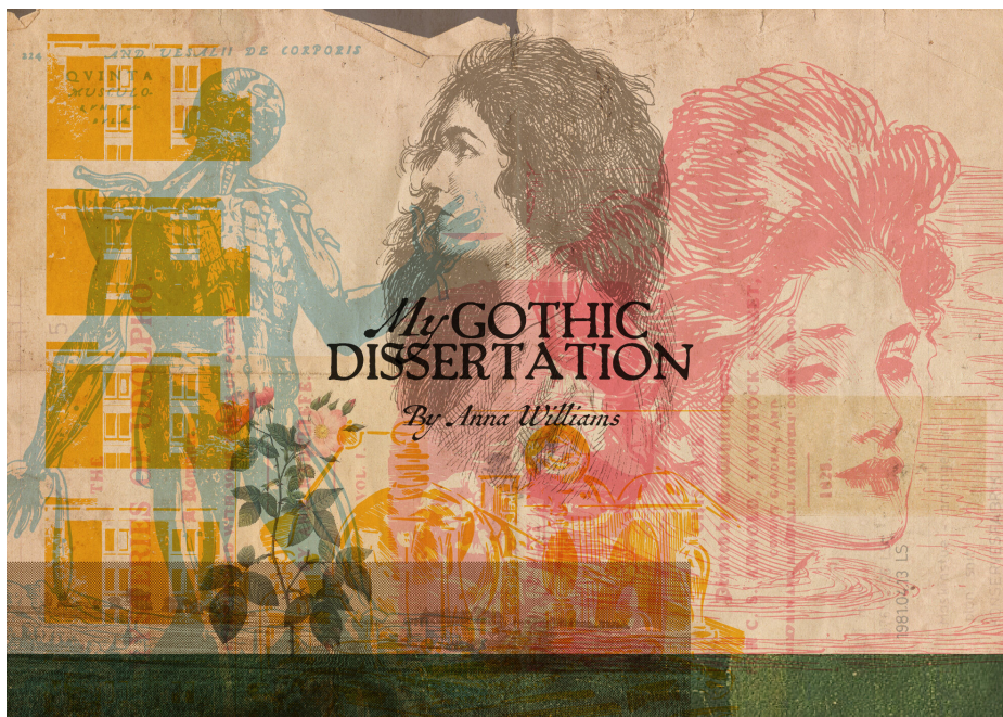
Figura 7: Portada del pódcast My Gothic Dissertation: A podcast . https://www.mygothicdissertation.com/