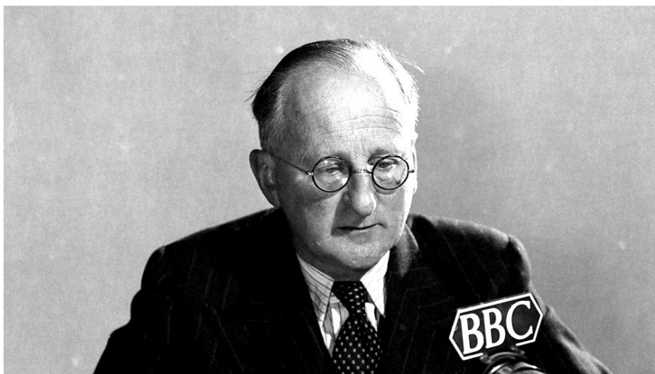
Figura 1: Nikolaus Pevsner ante los micrófonos de la BBC. https://www.bbc.co.uk/programmes/p00h9llv

Pero la radio siguió siendo el lugar desde el que la cultura arquitectónica podía difundirse, en ocasiones en simbiosis con la televisión. Así ocurrió con el curso A305, del programa Open University de la BBC, emitido entre 1975 y 1982 (figura 2). Frente a las imágenes que ofrecía la televisión, la radio contaba con los testimonios de los protagonistas, los autores de la arquitectura y el diseño industrial que rodeaba la vida de los británicos a los que iban dirigidas las emisiones. Joaquim Moreno ha rescatado estos archivos y muestra que, pese al tiempo transcurrido, la experiencia es un buen modo de aproximar la arquitectura al público general. En la exposición The University is Now on Air: Broadcasting Modern Architecture 2 se recreaban los espacios que habían formado parte del curso A305 y los materiales que se crearon para impartirlo. Fue una buena oportunidad para apreciar la colaboración entre la arquitectura, los medios de comunicación y la cultura de masas. Y como señala Alfredo Thiermann (2019), dejaba «una tarea clara: pensar cómo podemos hacer que nuestro conocimiento específico sea significativo y relevante para todos».