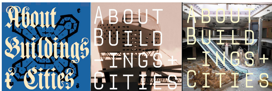
Figura 9: Portada del podcast My Gothic Dissertation: A podcast . https://www.mygothicdissertation.com/

consigue que el autor se vea mejor acompañado en su proceso de trabajo. Generan un resultado que puede ser disfrutado por un público ajeno a la disciplina que sin embargo está atento a los contenidos de investigación y divulgación arquitectónica. Con esto aumenta el alcance de la difusión de resultados, uno de los objetivos últimos de la investigación académica.