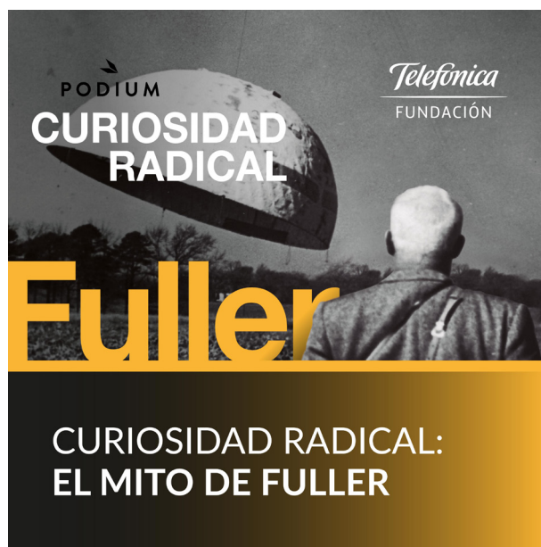
Figura 4: Portada del pódcast Curiosidad Radical . https://www.podiumpodcast.com/podcasts/curiosidad-radical-podium-os/