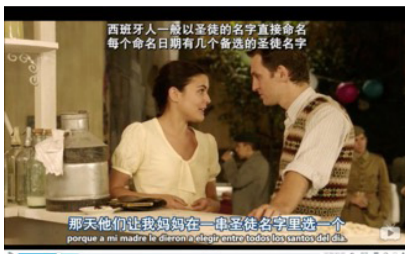
Figura 12. Traducción de un referente cultural en YYeTs

Podemos observar que, en esta escena, Sira le está explicando a Ignacio la historia sobre cómo le pusieron el nombre a ella. Dado que la historia está relacionada directamente con una tradición o costumbre española que puede causar extrañeza a los espectadores chinos, en la versión de YYeTs se añade una nota en la parte superior de la pantalla para explicar esta tradición, como se observa en la figura 12. Sin embargo, la nota es demasiado larga y está sincronizada con los subtítulos, lo cual impide que los espectadores lean toda la información sin detener el vídeo. En cambio, en la versión oficial, se ha traducido por su equivalente acuñado sin añadir ninguna información adicional.