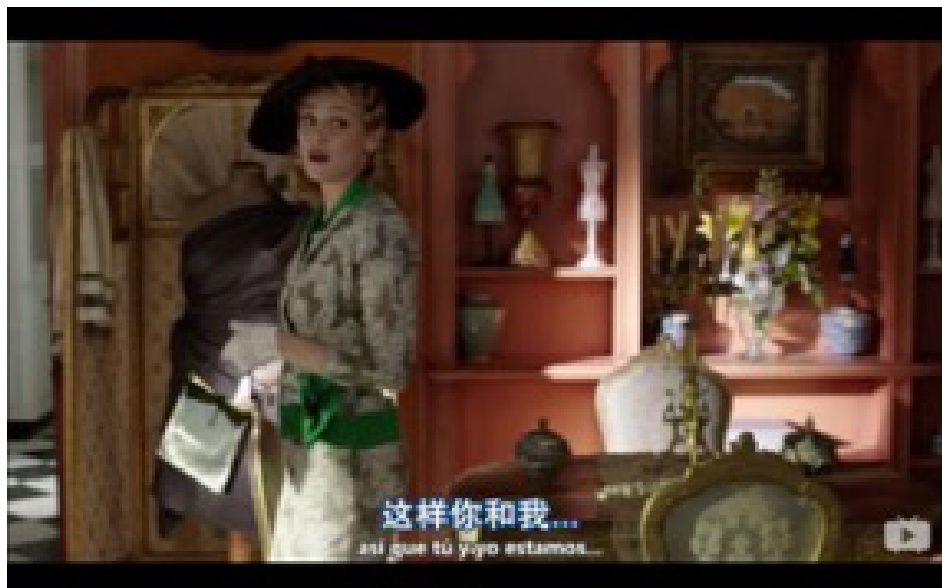
Figura 4. Uso de signos de puntuación en YYeTs