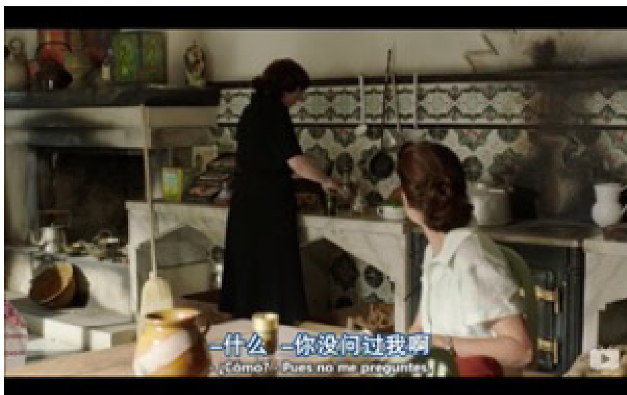
Figura 3. Intervención solapada de la versión de YYeTs

El tratamiento de las intervenciones solapadas de varias personas que hablan al mismo tiempo también es diferente en ambos casos. En la serie emitida por CCTV aparecen en dos líneas diferentes. Sin embargo, según las normas de subtitulación de YYeTs, en un diálogo entre dos personas, independientemente de la pausa que haya entre sus intervenciones o de la velocidad de habla, siempre aparecen en una línea, introducidas por un guion al comienzo de cada intervención, tal como muestra la figura 3.