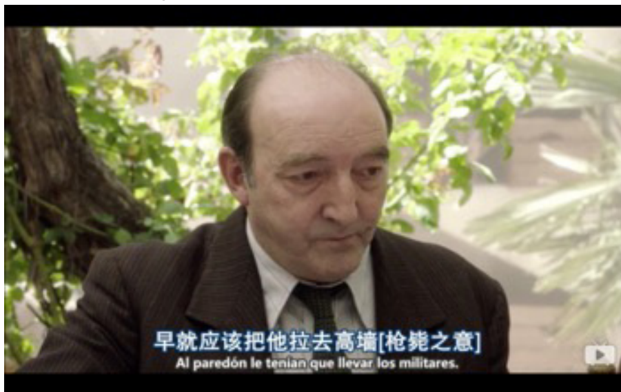
Figura 13. Notas al final del subtítulo de YYeTs

Sucede lo mismo en el ejemplo 6, en el que el término chotis se traduce con una generalización ( baile ) en la versión de CCTV, mientras que en la versión de YYeTs, se opta por transcribir la palabra qiaodisiwu (巧蒂斯舞) y se añade una nota en la parte superior de la pantalla en la que se explica que el chotis es un «baile en pareja que se puso en moda a principios del siglo XX en España».