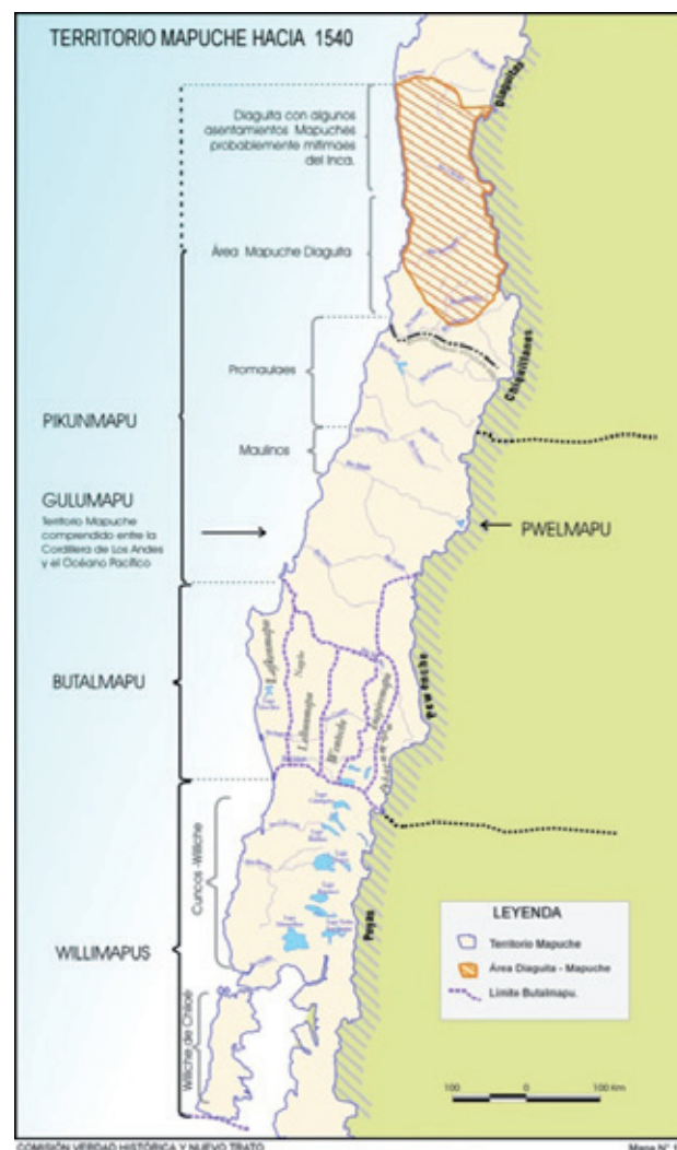
Mapa 1. Ocupación territorial mapuche en Gulumapu y Puelmapu (Chile y Argentina contemporáneos) hacia 1540