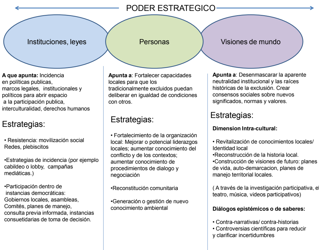
Cuadro 5: Estrategias para impactar sobre las esferas Personal, Institucional y Cultural

En el Cuadro 5 resumimos algunas estrategias que, en nuestra experiencia, pueden ayudar a potenciar el poder estratégico en cada una de estas esferas y contribuir con la transformación constructiva de conflictos socio-ambientales. A continuación pasamos a discutir dichas estrategias.