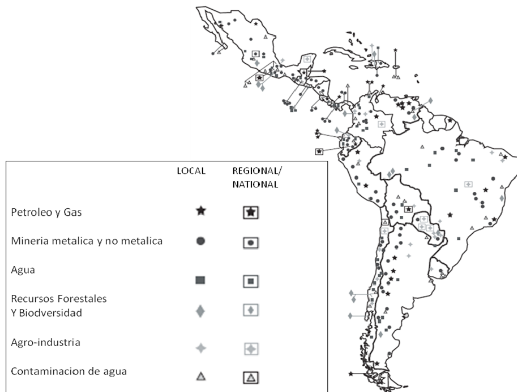
Figura 1: Mapa de conflictos socio-ambientales en América Latina