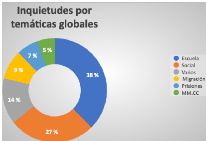
FIGURA 2. INQUIETUDES POR TEMÁTICAS GLOBALES

A partir de estos resultados, encontramos una serie de elementos que nos facilitan una reflexión y discusión con la literatura científica al respecto.