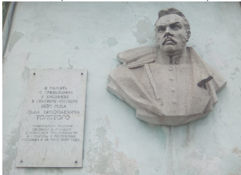
FIGURA 1. MONUMENTO EN KISHINEV (MOLDAVIA). EN ÉL APRECIAMOS A UN TOLSTÓI LUCIENDO UNIFORME MILITAR. AUNQUE SIEMPRE CONTRARIADO, AÚN ESTABA LEJOS DEL OBSESIVO RECHAZO DE LA VIOLENCIA QUE OCUPÓ PARTE DE SU MADUREZ Y TODA SU SENECTUD.

En cualquier caso, esta idea y defensa recurrente del cristianismo originario y evangélico no puede ser el único punto de atención en nuestra lectura. También en ella son esenciales la práctica de la paz y el rechazo absoluto de cualquier forma de coerción y abuso. El testimonio tolstoiano no es poderoso porque germinase en una de las mentes más perspicaces y prolíficas del siglo XIX, sino porque lo enuncia alguien que en su juventud asumió y vivió los valores castrenses propios de un conde en la Rusia zarista. Tampoco pretende ofrecer su mensaje como algo nuevo y sin precedentes, pues el valor de su llamamiento no consiste en ser original, sino en ser la enseñanza común en todas las tradiciones sapienciales.