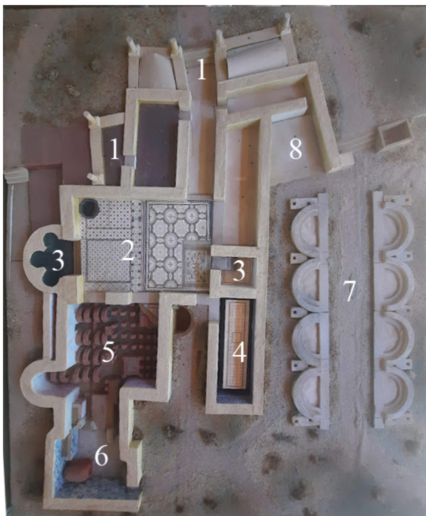
Figura 2. Reconstrucción de la planta general de las edificaciones de la fase III de Casa Hippolytus: 1: accesos principales; 2: patio central ( frigidarium ); 3: Piscinas; 4: Letrinas; 5: salas calientes; 6: praefurnium ; 7: Jardín; 8: templo de Diana.

En todo momento nos centraremos en la III fase de este collegia , que cuenta con un área de 640m 2 . ¿Qué partes tiene esta escuela que nos permite trabajar la vida cotidiana en un colegio con niños y niñas de Infantil? (Figura 2).