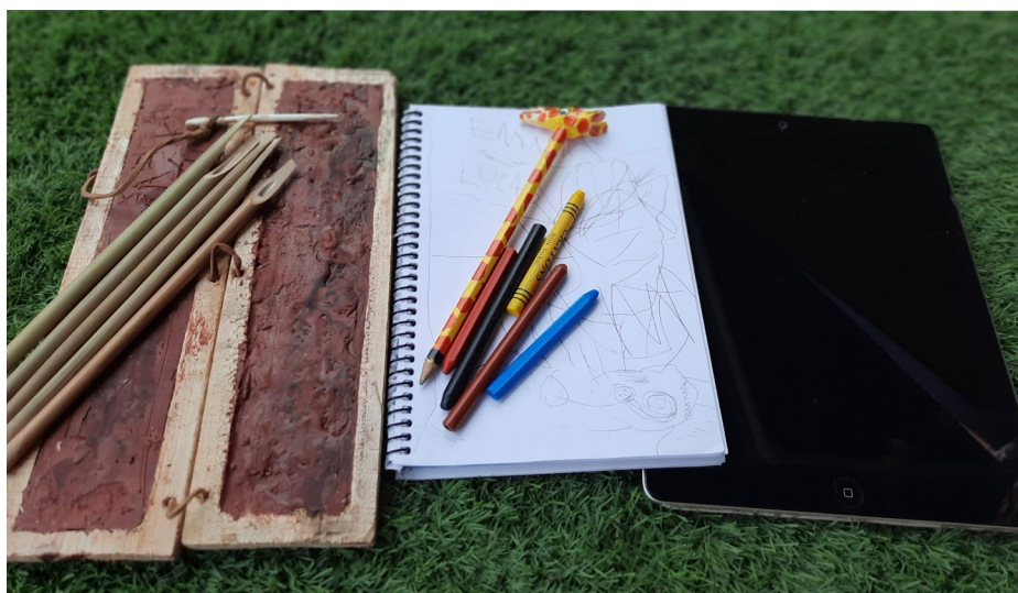
Figura 4. Comparación entre una tabula cerata y estilos, un cuaderno con lápices de colores y una Tablet.

Todos estos elementos, pueden ser comparados por niños y niñas con aquellos objetos actuales con los que ellos aprenden sus primeras letras y se adentran en sus primeras lecturas: cuadernos de distintos tamaños y grosores, papel, lapiceros, pinturas de colores, ceras, rotuladores, témperas, tablets incluso, son objetos cotidianos para niños y niñas de infantil, y apreciar la manera en la que han evolucionado estos objetos desde el pasado, pueden contribuir a aproximarlos a la dimensión temporal e histórica, a la vez que a conectar con la importancia de la escritura (Figura 4).