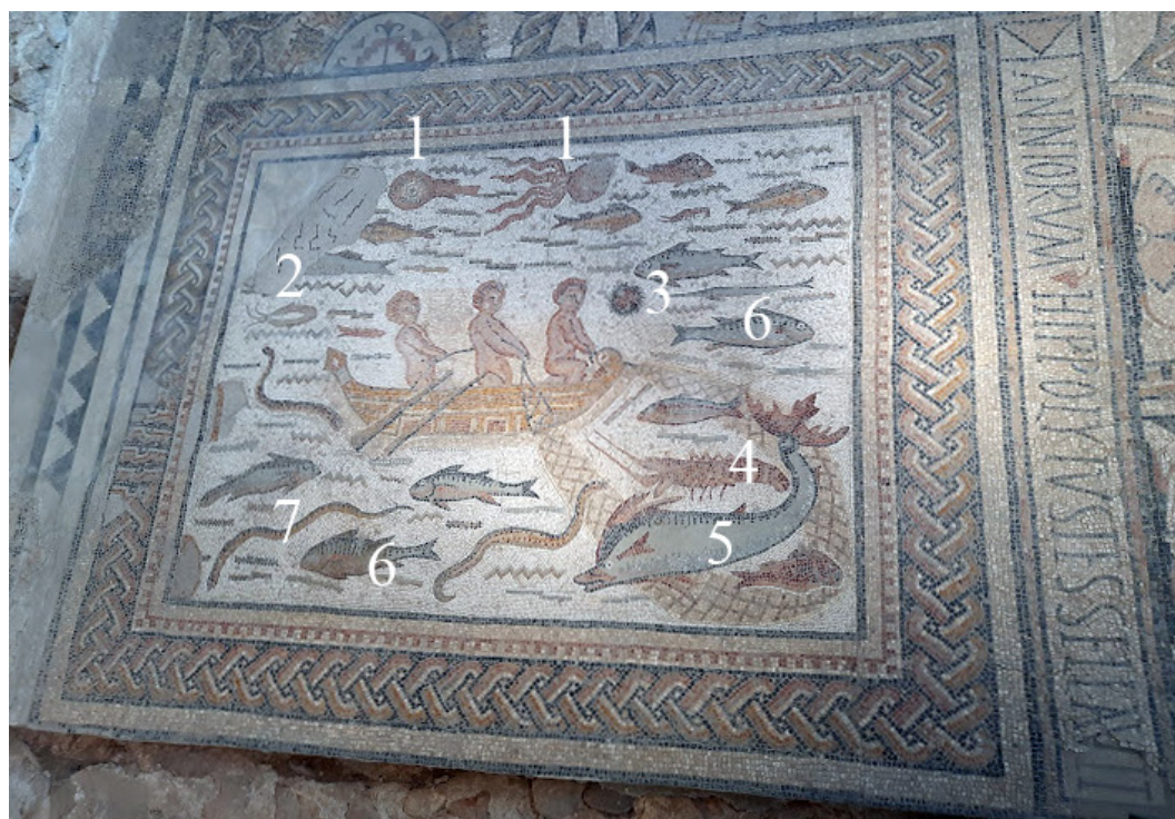
Figura 3. Emblema del mosaico de Casa Hippolytus. 1: Pulpos; 2: Sepia; 3: Erizo de mar; 4: Langosta; 5: Delfín; 6: Túnidos; 7: Morena.