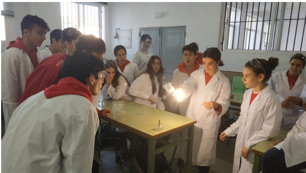
Figura 2. Alumnos en una práctica de la materia Laboratorio.