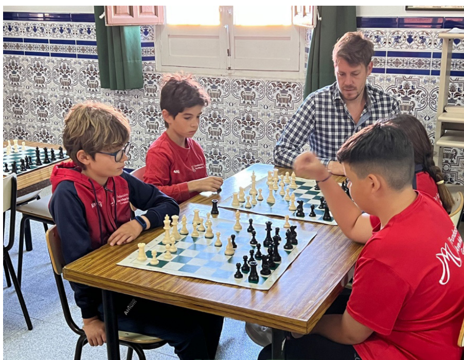
Figura 3. Mucho más que una partida de ajedrez.

Todo ello a la vez que se divierten jugando al ajedrez del que, estamos seguros, que disfrutan además durante su tiempo libre. Los resultados del proyecto están siendo muy productivos ya que se trata de una forma divertida en la que contribuimos a desarrollar su pensamiento lógico-matemático, a fomentar la creatividad y el cooperativismo y a desarrollar hábitos saludables para convivir y competir deportivamente. De este modo, con esta iniciativa seguimos poniendo en práctica y en valor el principio fundamental de la pedagogía manjoniana: aprender jugando.