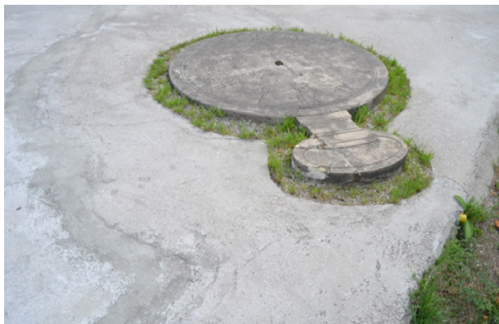
Figura 11. Reloj con números romanos.