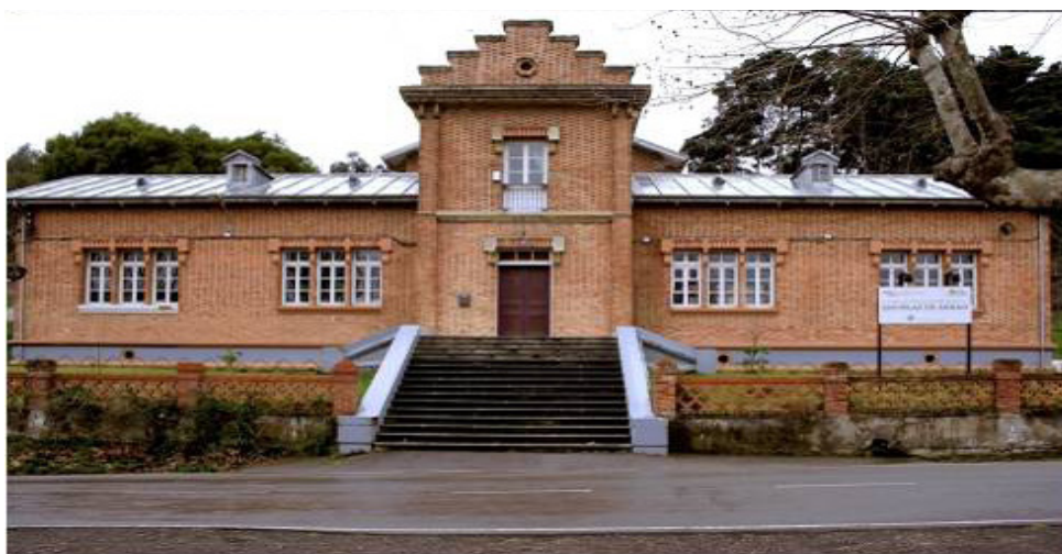
Figura 1. Fachada de las Escuelas del Ave María de Arnao.

La Real Compañía Asturiana de Mina (RCAM) fundó en Arnao (Castrillón), las Escuelas del Ave María, en 1913 a beneficio de sus empleados. La obra según proyecto del Arquitecto Tomas Acha Zulaica, formaba parte de las prestaciones sociales que les proporcionaba la Empresa, tales como viviendas, economato y hospital. Su fundación por la RCAM responde al tipo de escuelas que, en el contexto social de la Asturias de principios de siglo XX, eran promovidas en forma de paternalismo y filantropía desde el sector empresarial. Se buscaba así mejorar la preparación técnica de los asalariados y ordenar sus comportamientos, corrigiendo las malas costumbres y favorecer la creación de nuevos hábitos y usos, como la higiene individual y colectiva, el ahorro, la atención médica, la ordenación horaria, etc. Las escuelas de Arnao se inauguran el 3 de julio de 1913 con la presencia del Padre Manjón autoridades y altos cargos de la RCAM así como las autoridades civiles y eclesiásticas del Concejo. La Compañía asumía todos los gastos de mantenimiento de las Escuelas, tanto del continente como del contenido. Hasta que, precisamente, por razones económicas, estas Escuelas son cedidas al Estado, en el año 1979, encargándose desde entonces el Ayuntamiento de su conservación (García, 2004. pp. 36 y 160).