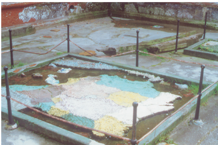
Figura 9. Mapa de España Sumergido.

En Arnao se practicaba desde el principio la metodología de la simulación para recrear viajes e historias en los mapas sumergidos. En los citados gráficos didácticos se pone en acción y se llevan a escena, hechos históricos e, incluso, ideas abstractas. Se personifican la historia, la gramática, la geografía, realizando viajes simulados entre otras propuestas didácticas (Figuras 9 a 12).