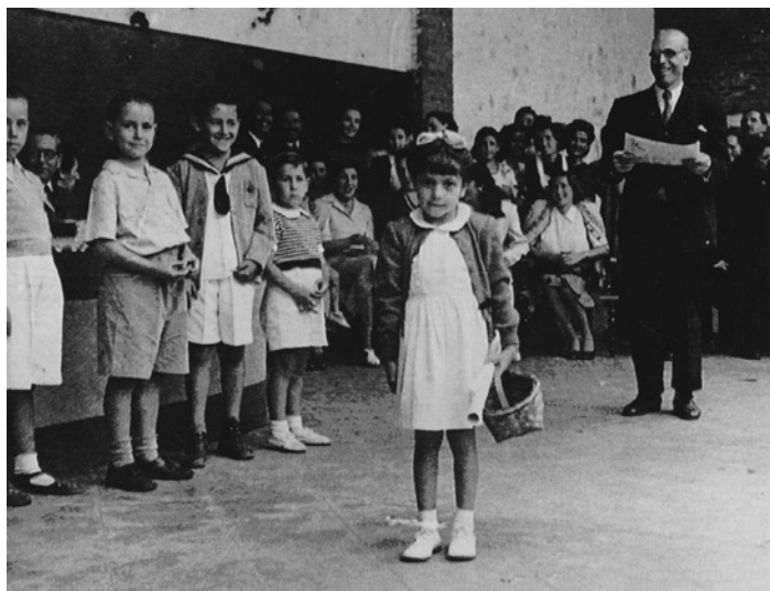
Figura 13. Fiesta fin de curso y entrega de premios.