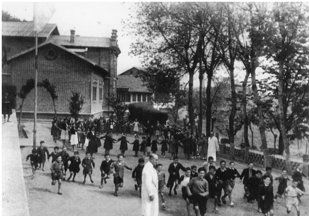
Figura 8. Arnao. Década de los 50. Alumnos/as con sus profesores practicando juegos en el patio de las Escuelas.

Son también interesantes en esta pedagogía, el uso de la dramatización, el valor concedido a la intuición, la construcción del material por el alumno, características típicas de una educación natural. Manjón, en su creencia firme de que somos obra de Dios, concede fundamental importancia a la formación religiosa en sus escuelas, valor en el que sustenta su pedagogía. Pero, sobre todo, sus escuelas eran escuelas de juego y acción (Fig.8). Manjón pone en práctica los principios de la Escuela Nueva, “el activismo personalístico y el gran valor del juego como medio de educación”. Como él mismo indica, “acercarse al ideal de enseñar jugando y educar haciendo”, mediante todo un sistema de juegos pedagógicos (Manjón, 1909).