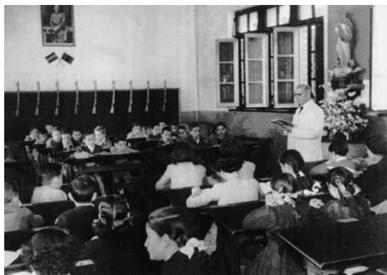
Figura 7. Interior del aula mixta de la Escuela de Arnao. Años 40, siglo XX.