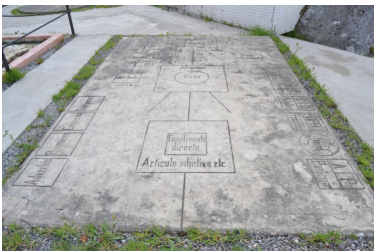
Figura 10. Gráfico para la enseñanza de la Gramática.