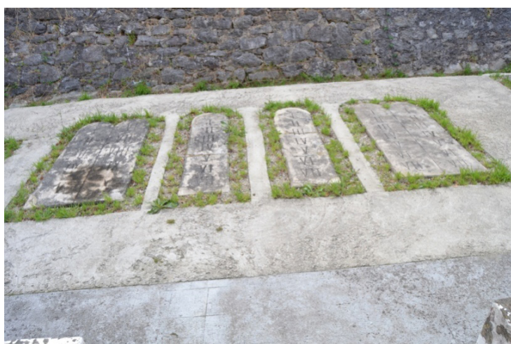
Figura 12. Tablas con números romanos.

D. Andrés fue uno de los defensores de la educación femenina. Este fue un objetivo claro en su pedagogía y por el que recibió las críticas más duras. La reacción contra la educación femenina se había testimoniado en el Congreso pedagógico español de 1882, cuando casi los dos mil cien asistentes se manifestaron en contra de Francisco Giner y otras personas de la Institución Libre de Enseñanza, ridiculizando y negándose a aceptar un programa de instrucción para éstas similar al del hombre. Sin embargo, en honor a la precisión histórica, Manjón hizo esta defensa y realidad de la educación femenina, a partir de argumentos sociales para regenerar al hombre español. Era la teoría muy en boga en políticos y pedagogos innovadores. Se trata de formar excelentemente a la mujer no por ella misma, sino como primera y fundamental educadora del hombre en sus primeros años, labor de extraordinaria importancia pedagógica y social. Anteriormente, el ilustre Jovellanos, ya manifestó su preocupación por la necesidad de la Educación femenina y lo hacía en el mismo sentido que después puso en práctica Manjón.