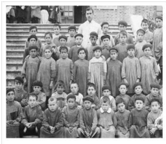
Figura 2. Alumnos de la Escuela de Arnao con su maestro, 1918.