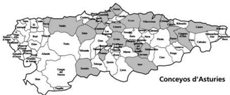
Figura 5. Mapa que indica los municipios asturianos que tuvieron escuelas o maestros manjonianos.