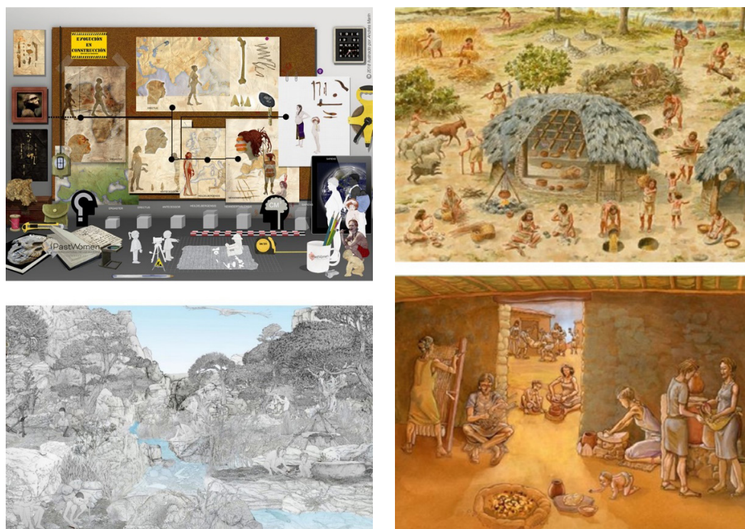
Figura 1. Láminas de la web Pastwomen para ilustrar la evolución humana, el Paleolítico Superior, el Neolítico Pleno y la sociedad argárica sin sesgos de género.

PASTWOMEN se inició la primera década del siglo XXI en el marco del proyecto de investigación “Los trabajos de las mujeres y el lenguaje de los objetos: renovación de las reconstrucciones históricas y recuperación de la cultura material femenina como herramienta de transmisión de valores” (2007-2010), financiado por el Instituto de la Mujer, y también del proyecto “La història material de les dones: recursos per a la recerca i la divulgació” (2010-2011) financiado por el Institut Català de les Dones. Posterior a este comienzo del grupo y la web, se ha conseguido formar un equipo profesional que tiene como objetivo principal dotar de visibilidad a las líneas de investigación en Arqueología e Historia que se vinculan al estudio de la cultura material de las mujeres, al tiempo que pretende proporcionar recursos actualizados desde las perspectivas feministas a todos los sectores involucrados en la divulgación histórica, ver Figura 1.