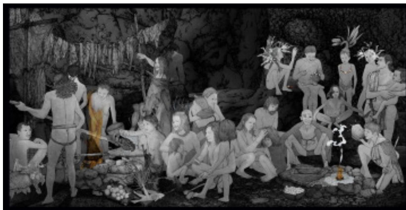
Figura 3. Láminas asociadas al Paleolítico Superior para ilustrar la construcción de la comunidad y las tecnologías cotidianas.

Por tanto, en esta línea, PASTWOMEN no solo es una herramienta coeducativa porque muestra sin estereotipos presentistas al 50% de la población que ha sido tradicionalmente omitida en la construcción del conocimiento histórico (las mujeres), sino que, además, se presenta como un instrumento útil para la educación en valores (el respeto a las diferencias y la tolerancia a la diversidad), al proporcionar argumentos sólidos y rigurosos sobre la diversidad social como una realidad atemporal, lo cual es clave para prevenir el acoso escolar en todas sus formas.