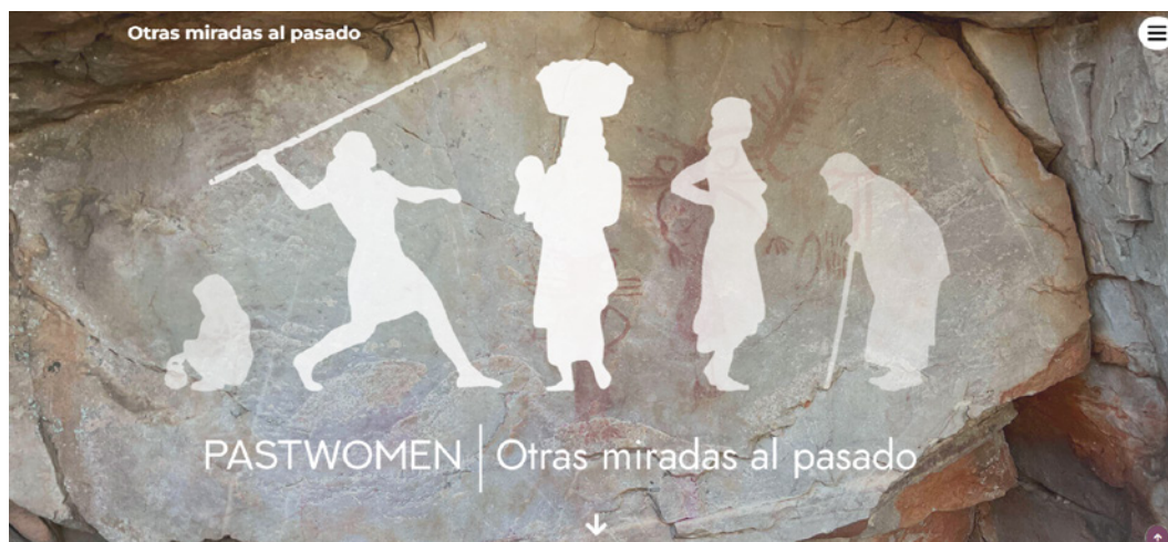
Figura 2. Imagen de la web de la exposición virtual "Otras miradas al pasado".

La estructura de la exposición Otras miradas al Pasado , recoge una presentación temática que pone en valor las aportaciones de las mujeres en los siguientes ámbitos: Las mujeres y el curso de la vida, Tecnologías cotidianas, Espacios vividos y Espacios de muerte. Estos apartados van precedidos por una introducción ( Otras miradas al pasado ) y finalizan con una propuesta de visitas virtuales y puntos de reflexión de la exposición ( Itinerarios educativos ), ver Figura 2.