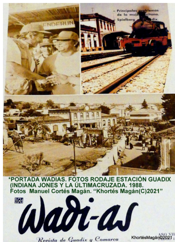
Figura 6. Fotos del rodaje en la Estación de Guadix ( Indiana Jones y la última cruzada)