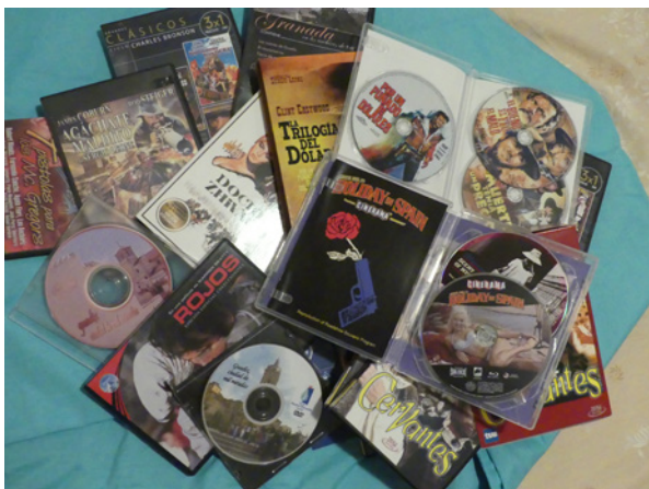
Figura 4. Rodajes en la Accitania, desde grandes producciones a modestos rodajes, incluso alumnos de un IES de Guadix, premiados con el Premio Nacional de Periodismo «Ciudad de Guadix» «Pedro Antonio de Alarcón». Con «Guadix, ciudad de mil miradas».

La Accitania florece como escenario de cine y en 1960 se rodará en ella una película innovadora: Holliday in Spain dirigida por J. Cardiff al aplicarse en su rodaje técnicas muy novedosas para la época como la elaboración de un guión pensado para la exhibición en sala mediante el uso del sistema Odascope (Smell-O-Vision), que hacía posible la liberación de aromas asociados a determinados fragmentos y pasajes del film. Un recurso que décadas después se ha vuelto explorar en los cines más vanguardistas que en una vuelta a lo ya explorado hace tiempo, lo denominan experiencias 360. Será un periodo en el que fijarán su mirada en esta tierra un francés para crear cine de terror, un inglés el suspense y un estadounidense el western. Este género cinematográfico será el que abra las puertas del cine popularizado, donde se magnifica al héroe americano, el paisaje y sobre todo el tren. Fórmula que sigue funcionando desde 1903, cuando Edwin S. Porter creó The Great Train Robbery (Asalto y robo de un tren). Hacer referencia a todas ellas excede los límites de este texto. Pero como ejemplo bas-