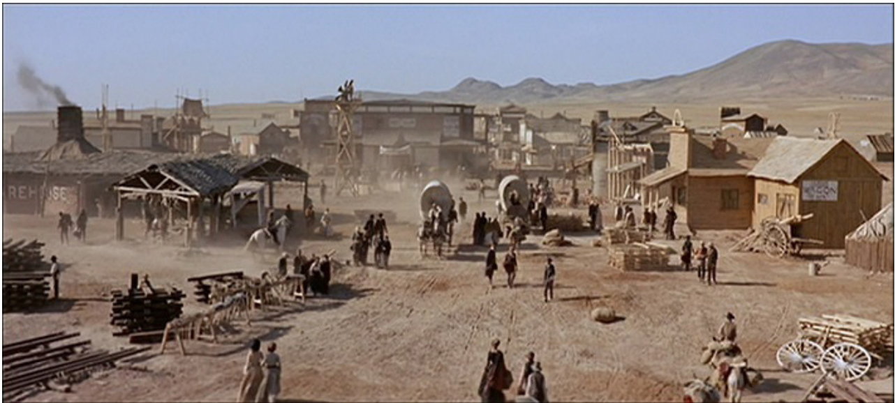
Figura 3. Poblado Leone en La Calahorra, Accitania.