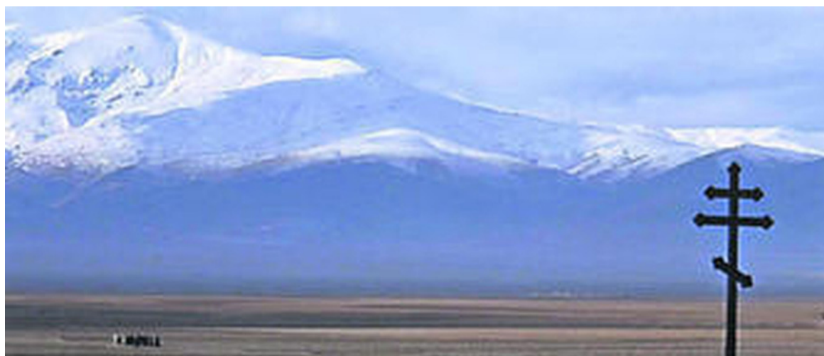
Figura 1. Páramo de la Accitania, con Sierra Nevada. Fotograma de DOCTOR ZHIVAGO. David Lean. (Diciembre 1964) https://youtu.be/q6zNIAXfWoE