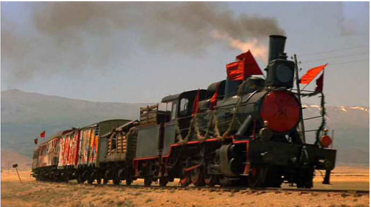
Figura 9. Fotograma de la película Reds (1981) dirigida por Warren Beatty con Warren Beatty, Diane Keaton, Jack Nicholson. En el se ve La GUADIX, Locomotora de vapor a través del páramo y al fondo Sierra Nevada. https://youtu.be/GbqFoGSzxYo

qualche dollaro in più, 1965) en un árido páramo, a mil metros de altitud, del municipio de La Calahorra, enclavados estratégicamente a las faldas de Sulayr, norte de Sierra Nevada y la sierra de Gor y el Valle del Zalabí. Recordamos a Lee Van Cleef deteniendo el tren y saliendo de un vagón con su caballo, y el castillo de La Calahorra que se «cuela» en plano. Genial igualmente Leone cuando hace hablar al silencio, con los larguísimos minutos de la llegada del tren, con los pistoleros esperando con solo tres caballos, mientras marca el ritmo un añado molino de viento. Curiosamente Al Mulock rodaría sus últimas secuencias, antes de intentar suicidarse, tirándose desde la ventana de un hotel en la ciudad de Guadix, por esa época en estos lares, pocos vicios de ese tipo se podían satisfacer. Acabo falleciendo por la tortuosa carretera hasta un hospital en Granada, los maledicentes re-