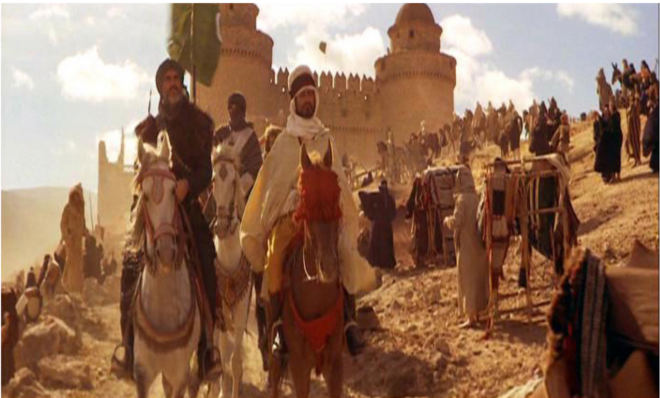
Figura 8. Castillo de La Calahorra . Accitana. El viento y el león es una película dirigida por John Milius con Sean Connery, 1975.