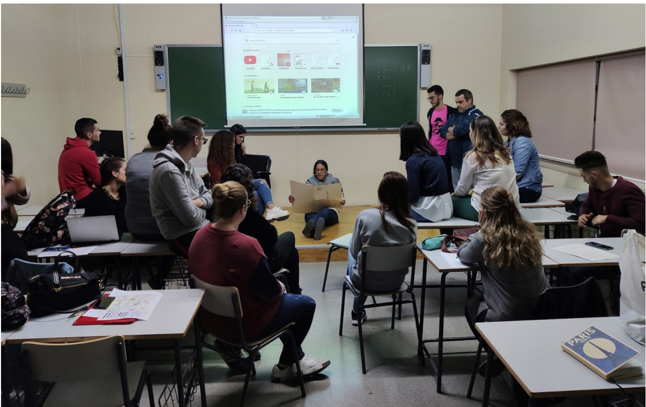
Imagen 1: Momento de la presentación de la innovación

Por último, el alumnado, en un 73,6%, respondió que tendrá muy en cuenta las narraciones como herramienta didáctica para trabajar contenidos relacionados con la historia local y las Ciencias Sociales, a la vez que un 21,9%, lo tendrá en consideración. Asimismo, un 4% de los y las participantes se expresó neutral ante la cuestión.