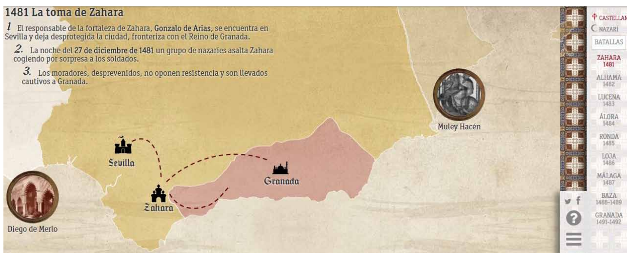
Imagen 5. Ejemplo de recurso educativo “La conquista de Granada”.

apartado llamado “Más Isabel”, mostrándonos una serie de datos históricos minutados en los que puedes pinchar y se te abre una nueva página en donde se realiza una explicación más detallada explicándote ese dato.