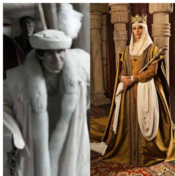
Imagen 2. Diferencias de vestimenta entre la corte francesa y la castellana.

Por ejemplo, si nos centramos en la cuestión del vestuario, con un alto componente cultural social y económico, esta nos permite establecer claras diferencias con respecto a otras personas, por ejemplo la pertenencia a un equipo de fútbol o religión nos hace vestirnos de unos ciertos colores por lo tanto tenemos unas ciertas creencias (Wagner, 2002). En la serie esto queda evidenciado en las ropas y la manera de decorar el palacio de cada reino es distinta, categorizando, además, los estamentos sociales. Un ejemplo claro de esto es el que vemos cuando aparece la corte de Francia donde sus trajes son más blancos que los de los castellanos que suelen ser más sobrios, o como también los aragoneses que a pesar de estar al lado de Castilla llevan otra vestimenta distinta (Fig. 2). Hablando de la ropa, otra diferencia clara que vemos incluso dentro del mismo reino es con