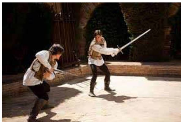
Imagen 1. Lucha de espadas como manera de ocio medieval.

das con el ocio como ir al cine o leer un libro. Estas acciones que nos parecen tan normales, en la Edad Media sería indispensables para ellos realizarlas ya que no disponían de los recursos necesarios y las desconocían, por ello en la serie observamos que su manera para divertirse era mediante la lucha de espadas o la caza. Esto hace que nuestra manera de pensar acerca del ocio sea mediante este tipo de actividades, pero años atrás tenían otra concepción de las maneras de entretenerse (Fig. 1). Pero no solo nos referimos a periodos de historia, sino que esto concierna también el lugar. Lo que comemos día a día está determinado por la zona en donde vivimos, en la serie esto se puede ver bien claro, ya que por ejemplo nunca los vemos comiendo pescado. Esto es debido a que habitaban en ciudades que se encontraban lejos del mar como era Segovia o Valladolid, cosa que una ciudad costera el pescado sería uno de los principales platos. Por ello, la manera de vivir de una zona no la limitan las fronteras de un país sino los recursos que se encuentran en esta (Crang, 1998).