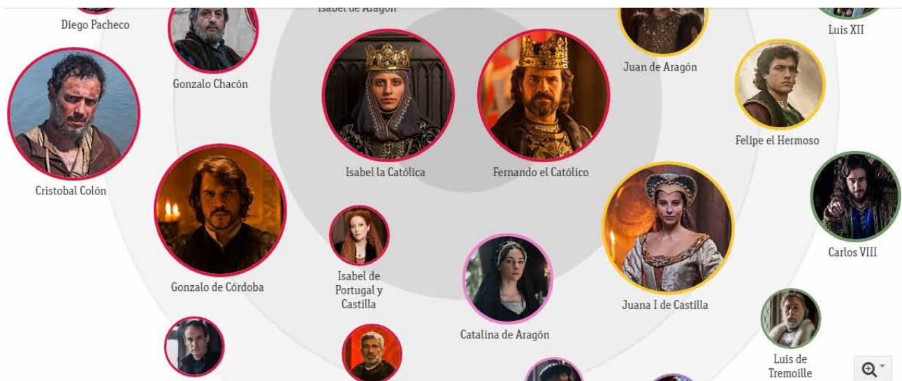
Imagen 4. Ejemplo de recurso educativo "Los personajes".

lia, aliados y enemigos). Por otro lado, se nos da la posibilidad de saber en qué capítulos aparecen cada uno de ellos. También podemos pinchar en un personaje y se nos abre una nueva página donde se nos ofrece una biografía de este (Fig. 4).