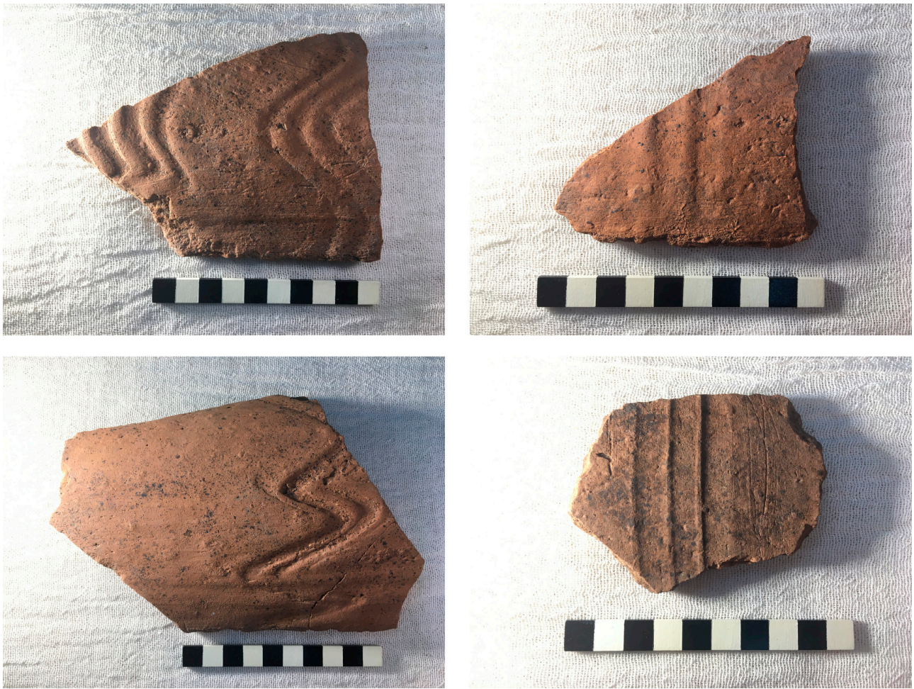
Fig. 5. Detalle de los distintos motivos incisos identificados en las tejas.

intencional, siendo el primer hallazgo de este tipo en el registro arqueológico de Buenos Aires. Los diseños corresponden posiblemente a dos motivos distintos, ambos compuestos por tres surcos paralelos: en el primer caso forman una sinusoide o figura ondulada, y en el segundo una guarda recta paralela al borde. Parecen haber sido practicados con distintos instrumentos ya que algunos presentan aristas vivas y otros no, siendo menos pronunciado el relieve, posiblemente realizado con los dedos.