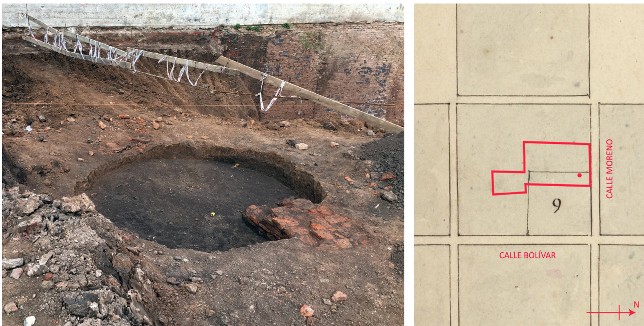
Fig. 2. Vista del pozo cubeta durante su excavación. A la derecha, su ubicación respecto al terreno actual y la “Casa del Obispo” (referencia N.º 9) sobre el plano de 1669.

nan las formas tipo plato y la decoración en azul sobre blanco, mayormente coincidente con tipos portugueses de inicios del siglo XVII. También se identificaron mayólicas del tipo Sevilla Blanco, Columbia Liso y Sevilla Azul sobre Azul. Entre los objetos de vidrio, se identificó al menos una botella de sección cuadrada y varios fragmentos de escaso espesor, transparentes y amarillentos, que podrían ser parte de objetos de vajilla de estilo veneciano. También se identificaron cinco cuentas de vidrio que corresponden a piezas elaboradas por estirado ( drawn beads ), de formas redondeadas en tonos azules y turquesa; una cuchara de cobre del tipo slipped end ; una cazoleta de pipa elaborada mediante talla sobre un bloque de arcilla; otros once bloques de arcilla color ocre (tosca) de tamaño irregular; restos arqueofaunísticos; carbón vegetal; entre los hallazgos más significativos.