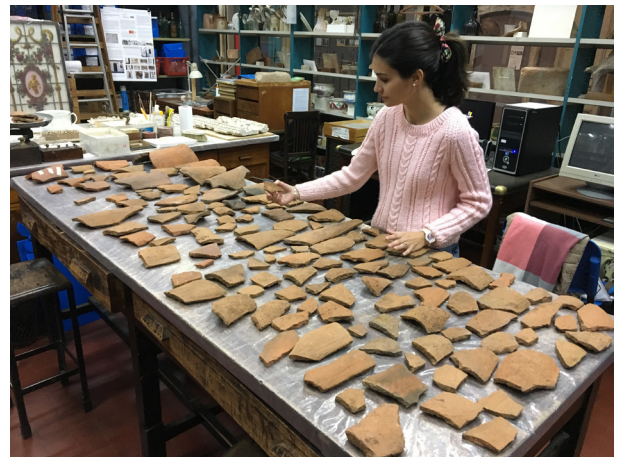
Fig. 3. Parte del conjunto de tejas hallado en el pozo cubeta de Moreno 550 durante las tareas de remontaje.

El conjunto de tejas recuperado consiste en 175 fragmentos, no habiéndose hallado ninguna pieza entera. Debido a que las tareas de remontaje tuvieron un alcance limitado por diversos factores, entre ellos el elevado nivel de fragmentación, se trabajó con otras técnicas para inferir la cantidad, la forma y sus dimensiones 16 . Se pudo calcular que el conjunto pertenece a un