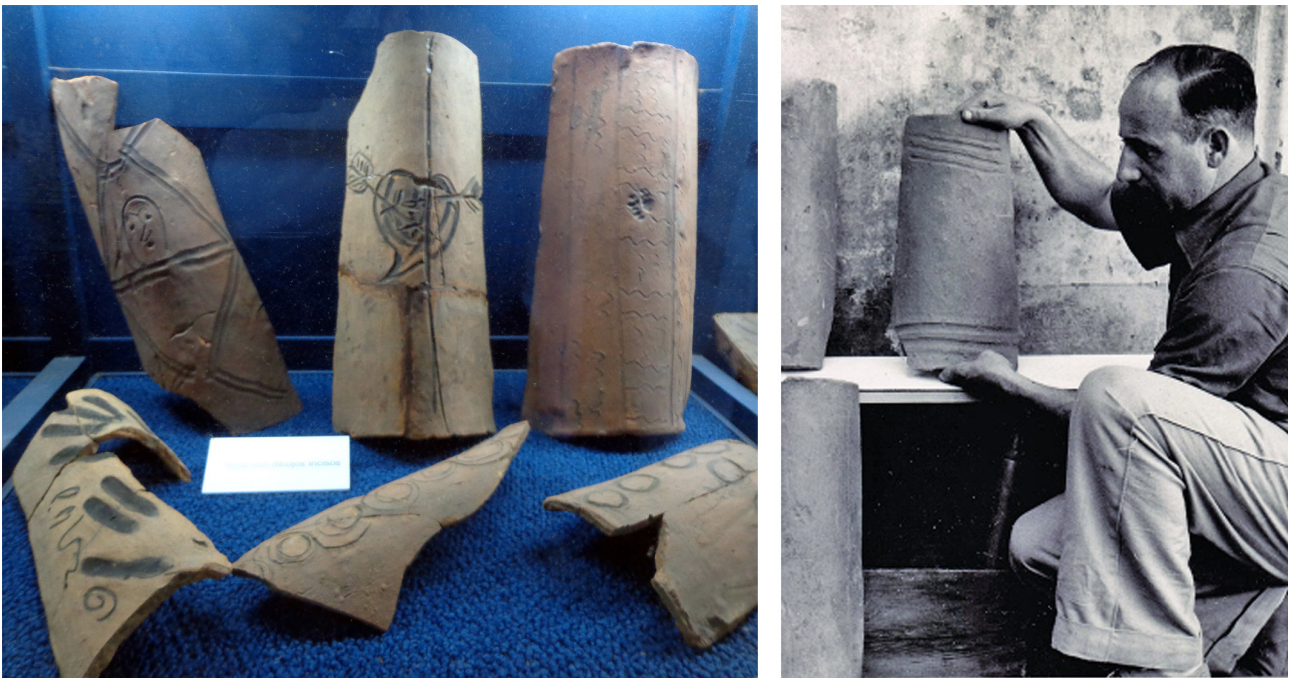
Fig. 6. Algunas de las tejas con diseños incisos de Santa Fe La Vieja, Cayastá. La imagen de la derecha presenta una pieza con diseño de guarda paralela similar a las de Moreno 550.

Otra distinción que vale hacer es respecto de las marcas generadas por acción involuntaria o fortuita, como la presencia de huellas de animales impresas durante el secado a la intemperie. O respecto las huellas dactilares propias de la manipulación de las piezas antes del secado, o el alisado o aplanado de las caras en el molde que pueden dejar este tipo de marcas. Tampoco se corresponden con las marcas del tipo grafiti, que fueron ejecutadas en la etapa de uso de las construcciones y generalmente para ser vistas. Aquí nos interesa trabajar otro tipo de fenómeno que se manifiesta en la expresa intención del artesano de dejar una impronta propia.