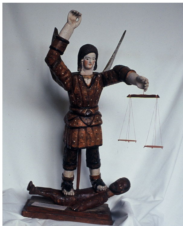
Fig. 8. Anónimo. San Miguel arcángel. Madera tallada y poli- cromada. Capilla de San Juan, Chiloé. Chile.

El contraste entre la precariedad de las capillas del archipiélago y la suntuosidad de la iglesia de San Miguel es evidente. Por un lado, la finura de los falsos mármoles de distintos tonos, la plata