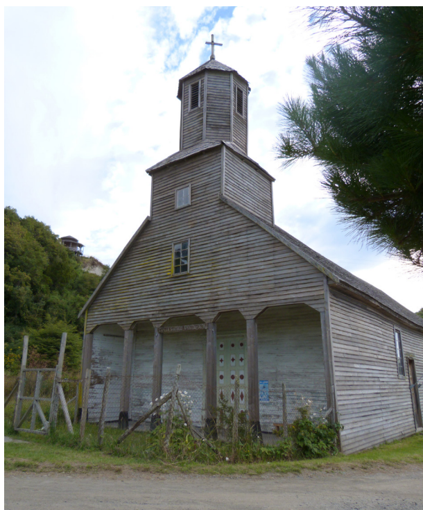
Fig. 6. Capilla Santiago Apóstol de Detif. Madera de coigüe y alerce. Primera mitad del siglo XIX. Chiloé. Chile.

se fortaleció la figura del fiscal, quienes recibían un proceso formativo en el colegio de Castro. En los puntos de detención de la misión circular, elegidos por ser desde antes sitios de reunión de la comunidad, se construyeron capillas de madera cada vez más estables 18 . En torno a ellas, con el paso de los años, se formaron pequeños pueblos 19 . Las capillas que se conservan actualmente, dieciséis de ellas declaradas Patrimonio de la Humanidad por la UNESCO, fueron construidas durante el siglo XIX o comienzos del XX y reemplazaron a las que los jesuitas levantaron en los lugares de detención de la misión circular.