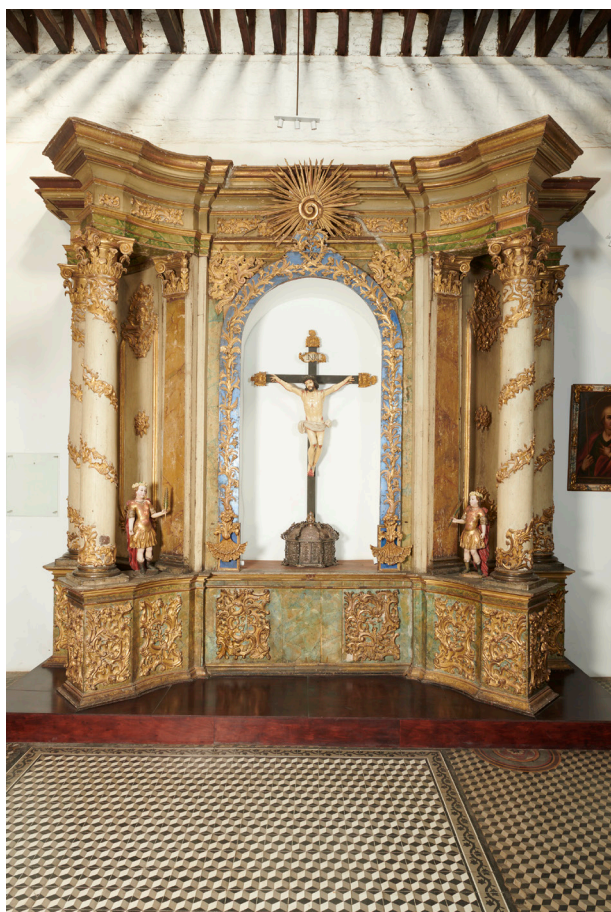
Fig. 1. Anónimo. Retablo de los Cinco Mejores- Madera con falso mármol y dorado. Circa 1760. Sacristía de la Catedral de Santiago, Chile.

con la llegada de un importante contingente de coadjutores preparados en diversos oficios técnicos y artísticos. Entre 1718 y 1754 arribaron a la Provincia de Chile cuarenta jesuitas que podían trabajar en platería, pintura, escultura, arquitectura, bordado, relojería, fabricación de órganos, carpintería, ebanistería, bordado y herrería 7 . De este modo las necesidades de mano de obra especializada se pudieron cubrir con los coadjutores que fueron arribando durante el siglo XVIII, la mayoría de ellos de origen germano. Su trabajo introdujo nuevas formas y soluciones, ajenas a la tradición hispanoamericana. La ornamentación rococó, una depurada técnica de falso mármol, así como un trabajo escultórico más naturalista que el característicos de los talla-