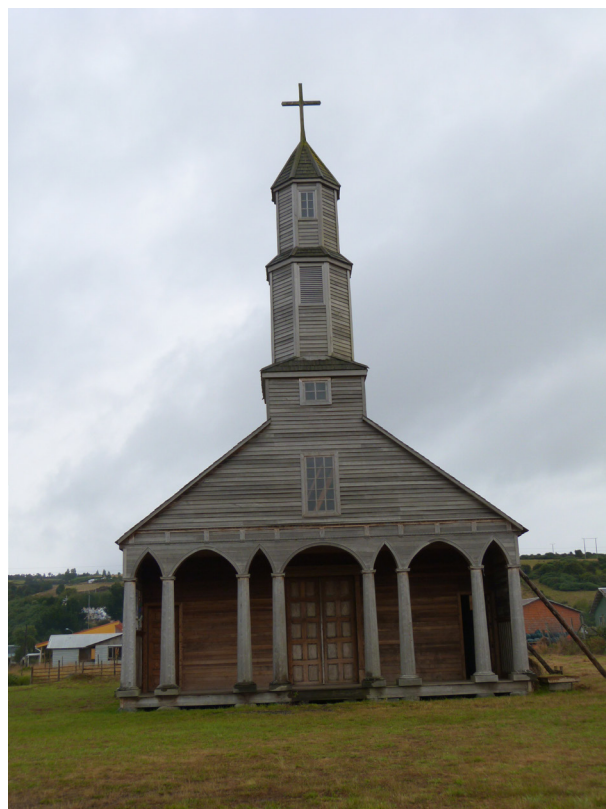
Fig. 7. Capilla Jesús Nazareno de Aldachildo. Madera de ciprés, coigüe y alerce. Comienzos del siglo XX. Chiloé. Chile.

Día 17 de septiembre. Que es cuando ya empieza la primavera, salen los padres misioneros del colegio; llevan consigo ornamentos de altar y lo necesario para administrar sacramentos, y aunque cada partido tiene su iglesia o capilla, pero la pobreza de la tierra no permite el que tengan altares, santos etc., si no es tal cual; y por esto los padres misioneros llevan consigo en un cajón triangular aforrado decentemente por dentro, un Santo Cristo, que tendrá de alto cinco o seis palmos, y a los lados tiene a Nuestra Señora de los Dolores y San Juan Evangelista; todo este cajón parado sirve de altar mayor bastante decente; a los pies del Santo Cristo, se pone el Santísimo Corazón de Jesús de bulto bastante grande con sus rayos dorados, y delante del