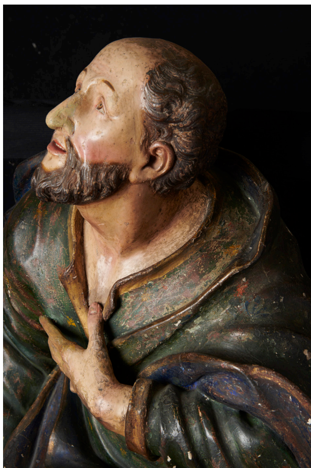
Fig. 5. Johannes Bitterich. San Joaquín. Madera policromada. Circa 1720. Catedral de Santiago. Chile.

como sus ornamentos sinuosos y asimétricos son juzgados como “obra a la moderna” 11 . Los retablos de falso mármol, adornados con ricos elementos de platería, albergaban pinturas y esculturas, predominando las últimas. Se trataba de piezas talladas en madera y policromadas ejecutadas, en su mayoría, por los cuatro coadjutores formados en escultura que arribaron durante la centuria, los germanos Johannes Bitterich, Adam Engelhardt y Joseph Kelner, junto al flamenco Jorge Lanz 12 . El naturalismo de sus trabajos, así como la gracia de sus posturas terminaban de configurar el carácter del interior de la iglesia santiaguina.