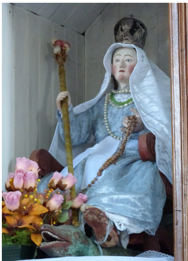
Fig. 9. Anónimo. Inmaculada sedente. Madera tallada y policromada con vestidos de tela. Capilla de Vilupulli, Chiloé. Chile.

El 22 de octubre de 1766 el padre José García comenzó un viaje de más de tres meses con el objetivo de reconocer las tierras al sur de Chiloé, registrando muchos aspectos de la travesía en un diario. La meta era llegar hasta el Estrecho de Magallanes, pero, el punto más austral al