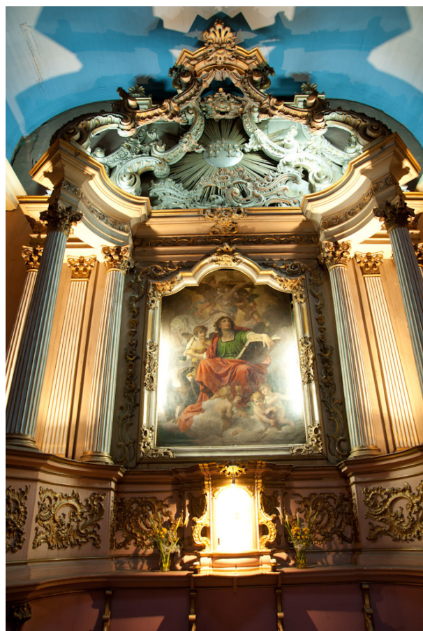
Fig. 2. Anónimo. Retablo de San Ignacio. Madera con falso mármol y dorado. Circa 1760. Parroquia de San Juan Evangelista, Santiago, Chile.