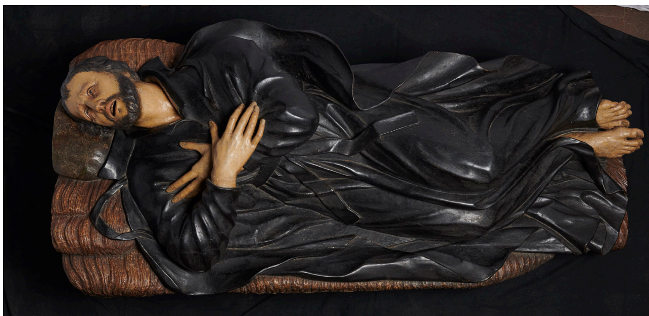
Fig. 4. Jacobo Kelner. San Francisco Javier yacente. Madera policromada. Circa 1760. Catedral de Santiago, Chile.

Siguiendo el modelo de la iglesia de San Pedro de Lima, el edificio santiaguino contaba con capillas que se unían mediante pequeños arcos, dando lugar a una particular estructura de tres naves. La bóveda de cal estaba atravesada por bovedillas en las que se abrían las ventanas que iluminaban el interior 10 . El retablo mayor y los nueve laterales obedecían a una misma concepción, la propia de los altares rococó bávaros de comienzos del siglo XVIII. Una estructura arquitectónica clara de un solo cuerpo y calle, columnas en diagonal, relieves ornamentales concentrados en el banco y el ático, gran parte de la estructura cubierta con falsos mármoles de diversos colores, uso de rocallas y de remates ligeros. Soluciones muy distintas a las máquinas cubiertas de ornamentación y pan de oro que albergaban casi todas las iglesias y capillas de Hispanoamérica. Estos retablos con apariencia de mármol y rocallas doradas en relieve estaban adornados con importantes trabajos de platería. Un lugar destacado ocupa en las descripciones de la iglesia de la Compañía el frontal del altar mayor. Sus representaciones, repujadas en plata, de San Miguel, San Ignacio y San Francisco Javier, así