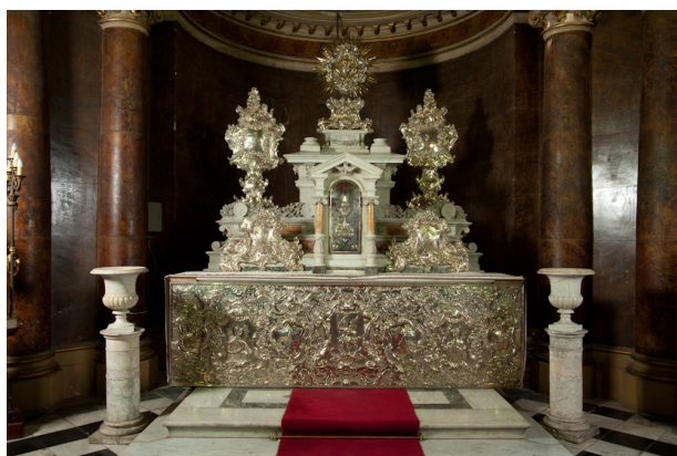
Fig. 3. Johann Joseph Köhler. Frontal de altar. Plata repujada. Circa 1760. Capilla del Santísimo de la Catedral de Santiago, Chile.

dores locales fueron los rasgos más distintivos de este cambio 8 . Las imitaciones de mármol y las rocallas se comenzaron a usar en algunos sitios de América a partir de la década del sesenta de la centuria 9 . La incorporación de ellas en la renovación de la iglesia de San Miguel fue, por tanto, muy temprana, novedad que debió provocar un impacto significativo entre los vecinos de la ciudad de Santiago.