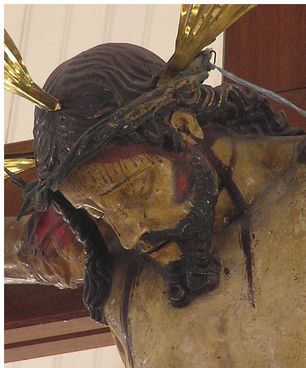
Fig. 4. Martín Alonso de Mesa. Crucificado, detalle cabeza. Madera policromada. 1603. Catedral de san Marcos. Arica. Chile.