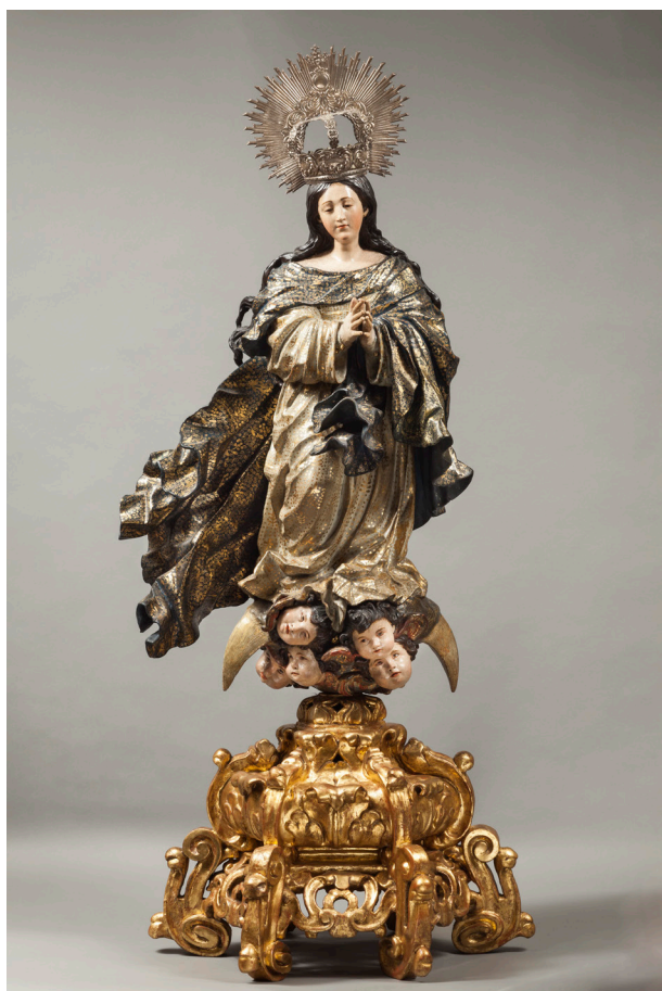
Fig. 4. Círculo de Ruiz Gijón (atrib.). Inmaculada Concepción. Escultura en madera policromada. Final s. XVII. Museo de Bellas Artes de Sevilla. Sevilla

contamos con otras obras seguras del autor que nos permitan realizar una comparación directa. Solo conocemos que contrató una inmaculada de tres cuartas con su peana por encargo de fray Juan de la Pasión, sacristán del convento de San José, de los Mercedarios Descalzos en 1677 36 , que Dávila, Pérez Morales y López-Fehan vinculado con la que se conservaba en la iglesia 37 y García Luque con la expuesta en el Museo 38 . También sabemos que Gijón concierta en 1680 con la cofradía de San Juan Evangelista y Ntra. Sra. de la Cabeza unas andas para el paso alegórico de la visión apocalíptica de San Juan, si bien es más que probable que ese paso —y su representación inmaculista— ni siquiera llegaran a ejecutarse 39 .