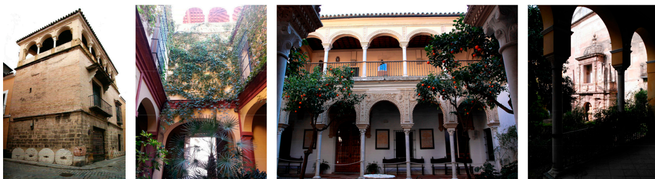
Fig. 1. Palacio de los Pinelo (esquina con torreón, patio apeadero, patio principal y jardín). 2017.