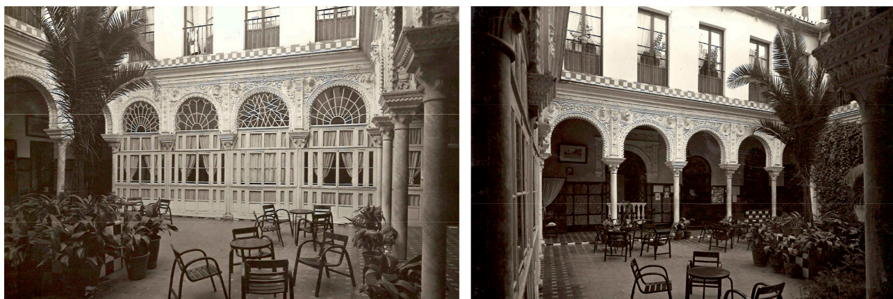
Fig. 7. Fotografías del patio principal de la pensión. h. 1950.