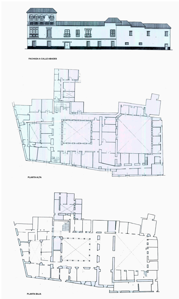
Fig. 4. Jesús Gómez-Millán. Fachada, planta alta y planta baja. 1964.