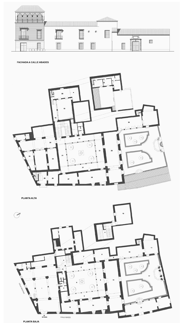
Fig. 5. Elaboración propia. Fachada, planta alta y planta baja (estado actual). 2017.

En el padrón de 1895 allí continuaba censado Marcos de la Rosa Jurado, jefe de la actividad industrial, por la que contribuía con mil pesetas, además de familiares ya inscritos en 1890. La lista de huéspedes aumentó y en varias hojas aparecían matrimonios, militares, etc.