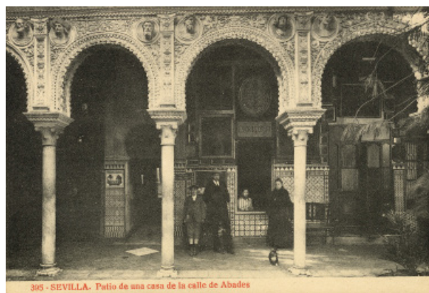
Fig. 10. Tarjetas postales del patio principal, editada por Purger & Co. München. Photochromiekarte n° 1878, circulada en 1903. editada por fototipia Thomas, Edición Almirall, Barcelona. h. 1907.

el estado del edificio hacia 1900 y su configuración actual.