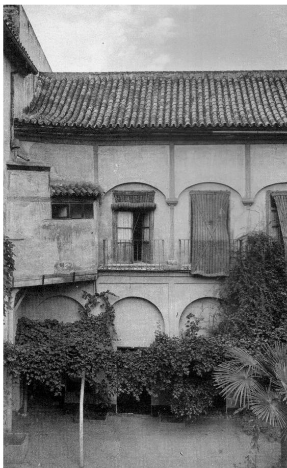
Fig. 8. Autor desconocido. Fotografías del segundo patio, hoy jardín. h. 1930. h. 1950. Publicada en Arquitectura Civil Sevillana (1976).