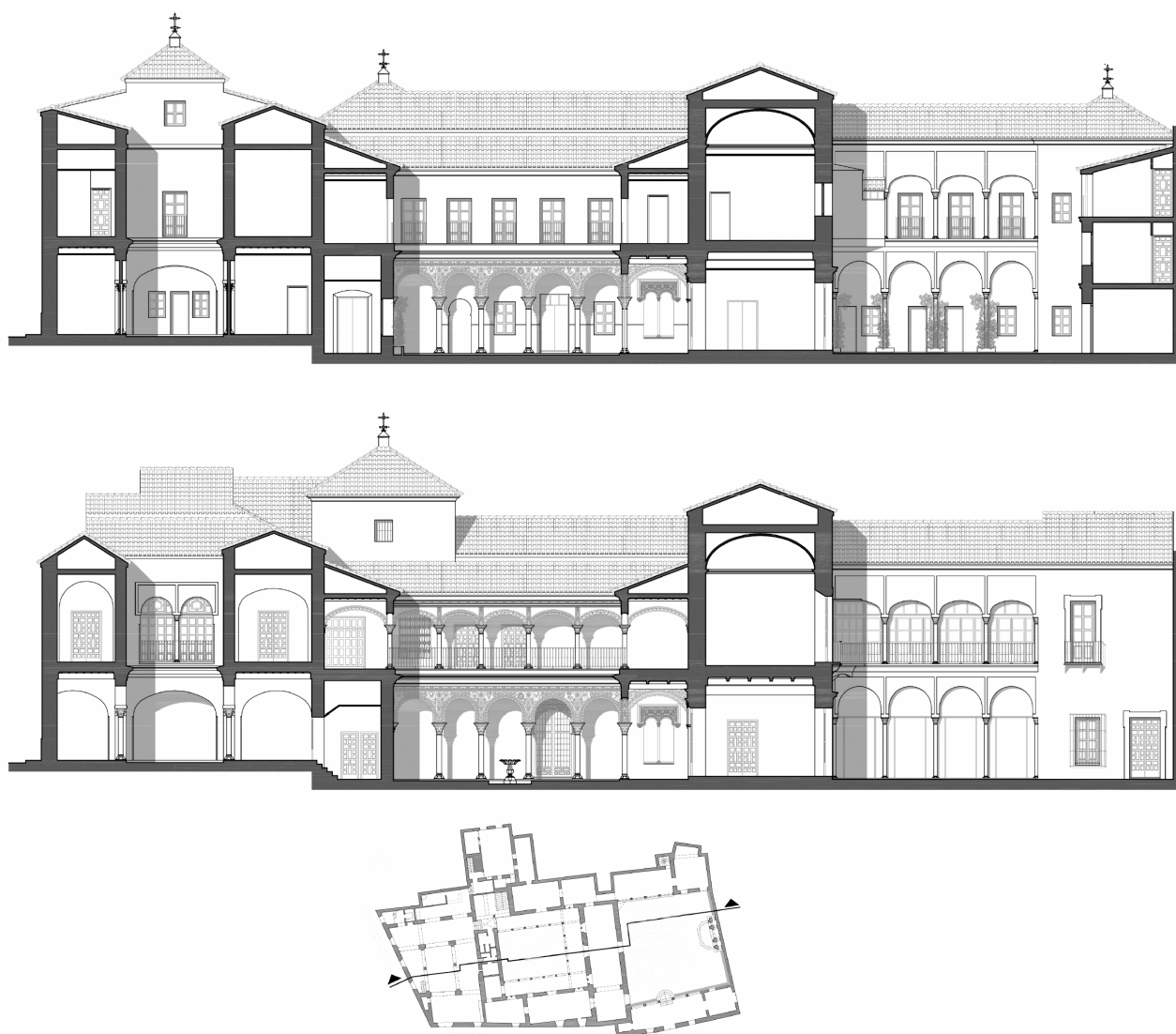
Fig. 6. Elaboración propia. Secciones longitudinales hacia 1900 y estado actual. 2017.

de ventana a la derecha de la puerta cochera y centrada con el hueco que existe en el piso principal 20 . Se abriría entonces una ventana hoy situada junto a la entrada principal del edificio, al pie del torreón.