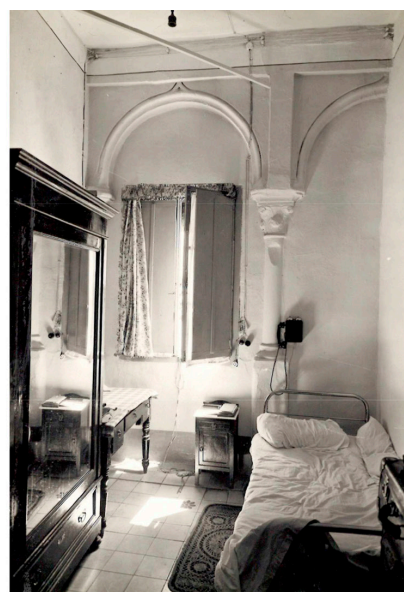
Fig. 9. F. Collantes de Terán y L. Gómez Estern. Fotografía exterior del torreón, h. 1950. Publicada en: Arquitectura Civil Sevillana (1976). Autor desconocido. Fotografía interior del torreón. Gerencia Urbanismo, Sevilla.