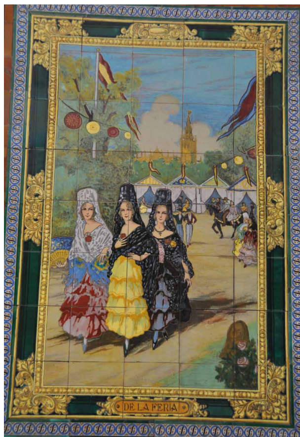
Fig. 3. Panel cerámico “De la Feria”. Centro Andaluz, La Habana.

neras siguiendo los modelos de García Ramos y el resto de pintores de su generación. Parece claro que fueron los contactos de Cuenca en Sevilla los que debieron facilitar el envío 10 . Por lo demás se trata de un edificio de carácter residencial articulado por un pequeño patio de luces. Consta de dos plantas cuyo acceso por la escalera se realiza por el fondo del edificio. La fachada sigue los modelos decimonónicos característicos del Paseo del Prado habanero, con un pórtico adintelado y una terraza en la primera planta. En marzo de 2014 el Centro Andaluz se encontraba cerrado al público por carecer de licencia de apertura. Aunque la vida interna de la institución continuaba para los socios, no tenía el impacto que con anterioridad había ofrecido a la ciudad.