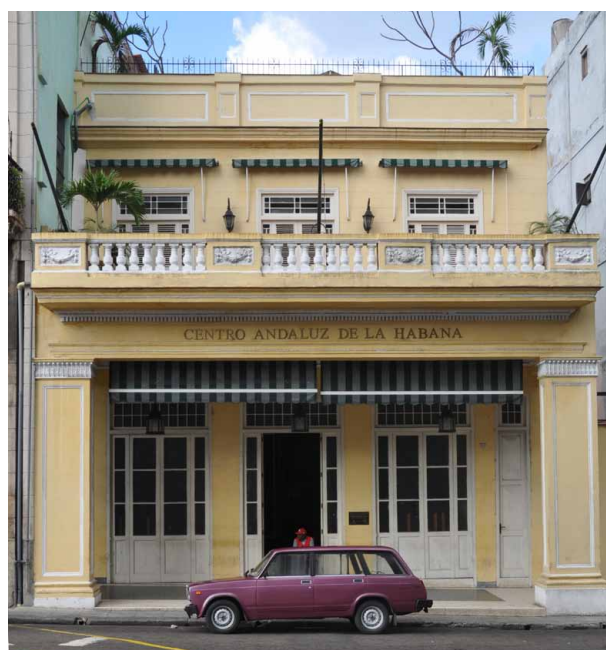
Fig. 4. Fachada. Centro Andaluz, La Habana.

neras siguiendo los modelos de García Ramos y el resto de pintores de su generación. Parece claro que fueron los contactos de Cuenca en Sevilla los que debieron facilitar el envío 10 . Por lo demás se trata de un edificio de carácter residencial articulado por un pequeño patio de luces. Consta de dos plantas cuyo acceso por la escalera se realiza por el fondo del edificio. La fachada sigue los modelos decimonónicos característicos del Paseo del Prado habanero, con un pórtico adintelado y una terraza en la primera planta. En marzo de 2014 el Centro Andaluz se encontraba cerrado al público por carecer de licencia de apertura. Aunque la vida interna de la institución continuaba para los socios, no tenía el impacto que con anterioridad había ofrecido a la ciudad.