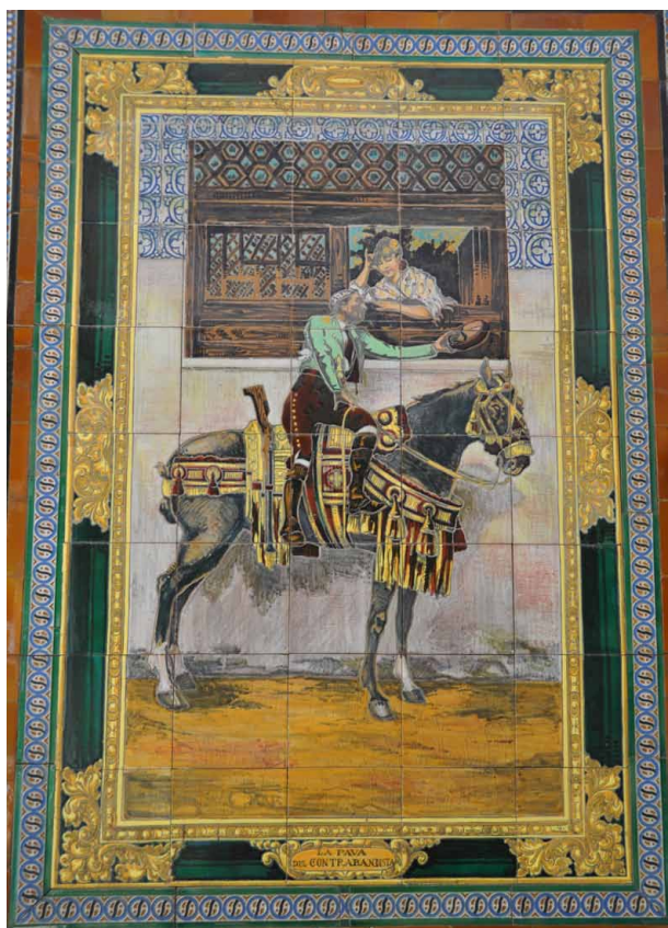
Fig. 2. Panel cerámico “La pava del contrabandista”. Centro Andaluz, La Habana.