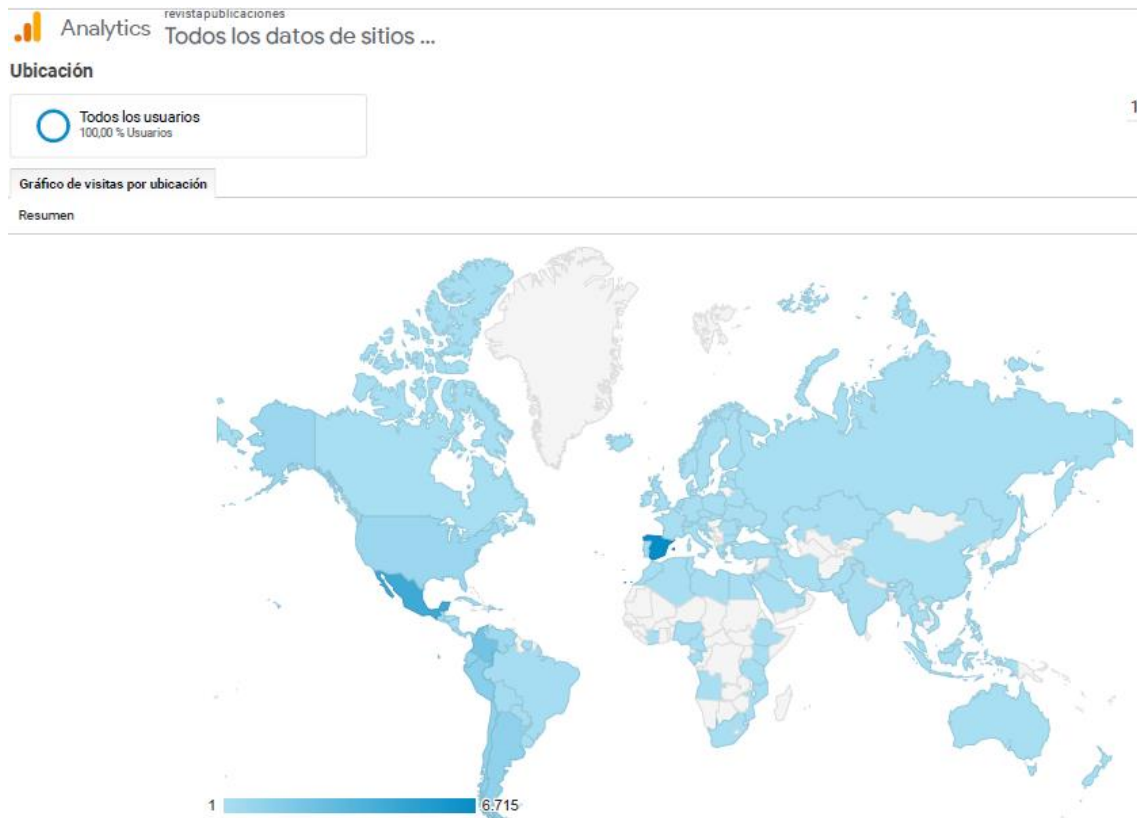
Figura 1. Lugares geográficos desde los que se ha accedido a Publicaciones desde octubre de 2019 a enero de 2021.

En cuanto a los lugares geográficos desde los que se accede a la revista, la siguiente figura (ver figura 1) indica que Publicaciones se ha visitado durante 2019 (desde octubre) y 2020 en todos los continentes. Por países, principalmente se ha accedido a la revista desde México y España.