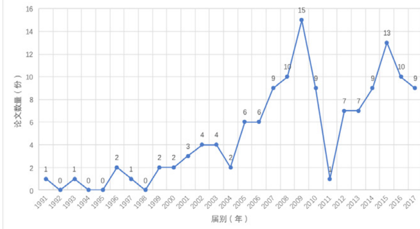
图1 上海外国语大学西班牙语语言文学硕士论文年度分布情况