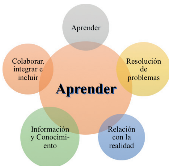
Figura 1. Objetivos para la incorporación de las TIC en la educación (adaptado de Cabero, López y Llorente, 2009:17)

Para ello, Cabero, López y Llorente (2009) señalan la necesidad de promover un replanteamiento de los objetivos y resultados de aprendizaje que se pretenden lograr. Así pues, para que se haga de manera efectiva y contemple a un colectivo diverso es necesario partir de unos puntos básicos sobre los que establecer su inclusión en el currículum