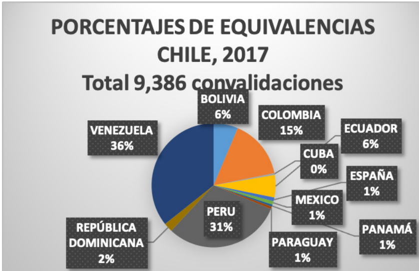
Figura 1. Equivalencias de los países del CAB realizadas en Chile en el año 2017

Esa herramienta aporta al reconocimiento expedito de talentos humanos que ingresan a los centros escolares, sin dilación. Por ello, se presentan a manera de ejemplo las Figuras 1 y 2, que reflejan la agilidad de la Tabla para la integración e incorporación de estudiantes a los sistemas educativos nacionales de los países del CAB.