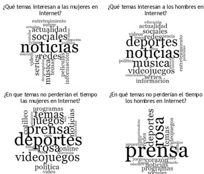
Figura 1. Nubes de las 20 palabras más frecuentes por sexos. Temas de interés y no interés en Internet

hombres la prensa rosa (19). En la Figura 1 se pueden observar las veinte palabras más frecuentes respecto a los temas que interesan y no interesan a las mujeres y los hombres, representadas en nubes de palabras.