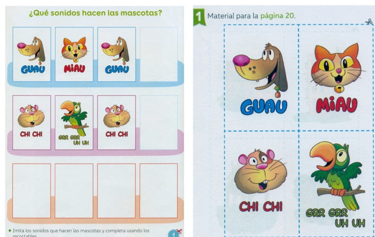
Figura 3. Tarea de seriación a partir de patrones de repetición para 4 a 5 años, indicador 11.

Por otra parte, en cuanto a las tareas matemáticas vinculadas con el nivel de 4 a 5 años que tienen relación con la seriación a partir de un patrón de repetición, destaca el indicador 11 (10,8%), referido a ampliar una secuencia. Mientras que en el nivel de 5 a 6 años prevalece el indicador 13, vinculado con identificar la unidad de repetición de un patrón, con una presencia del 9,4%. Las figuras 3 y 4 ejemplifican este tipo de tareas.