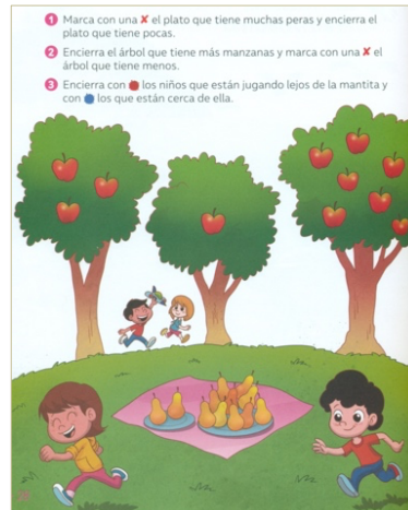
Figura 2. Tarea de establecer relaciones a partir del reconocimiento de atributos al experimentar con elementos u objetos para 5 a 6 años, indicador 8. Fuente: T6 (2018, p. 28)

Al igual que en ejemplo anterior, los estudiantes para dar solución a la tarea, requieren comparar elementos a partir de la relación que se da entre los objetos, aplicando distintos criterios de cantidad, como lo es, muchos/pocos, más/menos.