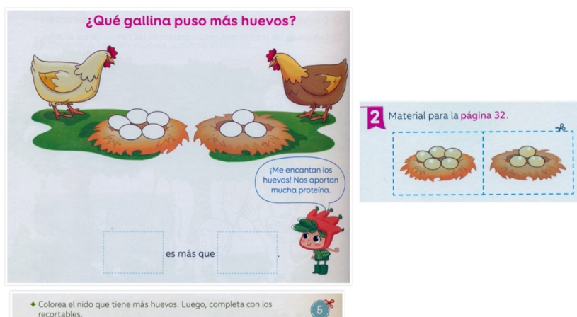
Figura 1. Tarea de establecer relaciones a partir del reconocimiento de atributos al experimentar con elementos u objetos para 4 a 5 años, indicador 8.

Podemos observar que tanto en el nivel de 4 a 5 años como en el de 5 a 6 años, los libros de texto proporcionan mayoritariamente tareas matemáticas vinculadas con establecer relaciones a partir del reconocimiento de atributos, donde predomina el indicador 8, asociado con la comparación de elementos cualitativos y cuantitativos, alcanzando una presencia del 26,9% y 20,3% en cada nivel, respectivamente. Un ejemplo de este tipo de tareas se muestra en las figuras 1 y 2.