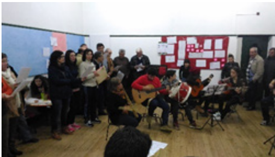
Imagen 1 3 - Ensayo de la ContiTuna

Finalmente, en este apartado, referir el cuidado estético en crear un traje propio para la ContiTuna , que viste de negro y usa un pañuelo verde pistacho, lo que los miembros ven con mucho orgullo y es muy bien recibido por el público que disfruta de sus actuaciones.