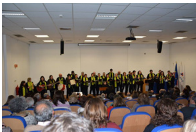
Imagen 10 - La ContiTuna en el Congreso Internacional "Bajo el Signo de las Musas - Artes y Educación"

El factor decisivo para el suceso de la iniciativa reside en una considerabilísima conexión con la comunidad local, asegurada por la alumna/ Maestrina, y su rápida aceptación del reto implicado en la sugerencia de una intervención sociocultural por medio de la Música. Esto se revela en su profunda implicación comunitaria y sus raíces locales, a lo que se añade la especial capacidad de relación con los habitantes, sus conterráneos, y la aptitud a motivarlos y enseñarles. Hay, igualmente, que señalar muchos lazos personales de relación familiar y social entre los habitantes de Contige que integran la ContiTuna . De todo esto, resulta una amplísima adhesión de la población a la ContiTuna , hoy ya otro motivo de orgullo identitario, espiritual y simbólico local y comunitario, además del famoso eucalipto clasificado y protegido. En ese sentido, terminamos el artículo con imágenes de un momento mayor de la actividad de la ContiTuna , actuando en el ámbito de un congreso internacional dedicado a las artes, su enseñanza e investigación, que tuvo lugar en Coimbra, en el mes de enero de 2017. La calidad del trabajo producido fue ampliamente reconocida por participantes y asistentes en el mismo, muchos especialistas en Educación Musical y Musicología, posibilitando una amplia proyección local e internacional.