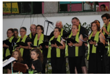
Imagen 7 - ContiTuna actuando

El Repertorio de la ContiTuna , desde su fase inicial, incluye una diversidad de canciones sin preocupación específica de atender a cualquier criterio popular, tradicional o folklórico. Se trataba de hacer con que un conjunto de personas sin conocimiento y formación musical se agrupara para cantar y tocar, atendiendo a los objetivos socioculturales definidos. En ese sentido, se recorrió a todo tipo de canciones disponibles y accesibles, donde se encuentra una diversidad muy señalada (desde canciones más tradicionales a canciones en moda actualmente, todas dentro de los gustos personales de los Tunos-practicantes y factibles de interesar a la gente más joven); a esto se añadió un conjunto de sugerencias hechas por la Maestrina.