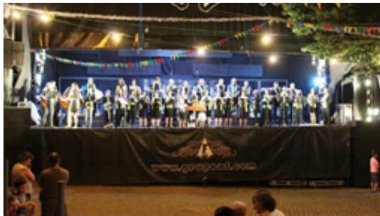
Imagen 6 - ContiTuna actuando