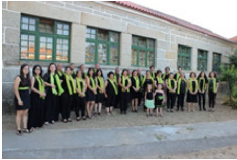
Imagen 4 - ContiTuna frente a su Sede