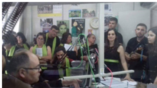
Imagen 3 - ContiTuna en la “Rádio Emissora das Beiras”

La ContiTuna hizo su estreno oficial en una actuación incluida en las conmemoraciones oficiales de los 905 años del Foral de la Vila de Sátão, que se celebraron en el día 15 de Mayo de 2016. El Cine-Teatro de Sátão (con cerca de 200 plazas) fue el escenario, y no hubo donde acoger a la población que lo llenó, tanto en lo que respecta a las plazas sentadas como en todos los espacios disponibles para que la gente pudiese quedarse de pie. Se realizó la grabación oficial de esa actuación con la que se inició una larga lista de espectáculos en la región, animando fiestas públicas, institucionales y privadas. Además de la región, más cercana, ya se ha actuado en Lisboa y Coimbra, y en una Radio regional. En preparación, se encuentra una salida al extranjero (Francia o Luxemburgo), para acercar Contige y Sátão a sus emigrantes, proyecto más difícil de realizar por su elevada exigencia financiera y de disponibilidad de las personas, pero siempre en el horizonte de la gestión del grupo.