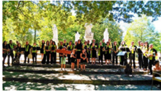
Imagen 5 - ContiTuna