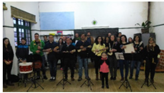
Imagen 2 - Ensayo de la ContiTuna

La práctica del proyecto I+DBP ha generado hasta el presente todo un conjunto de procesos y productos que podemos dividir en dos grandes sectores según sean inmateriales y materiales. Los primeros se perciben en el contacto con la población y la profunda dinámica en la que la ContiTuna la ha envuelto; eso se constata en el dinamismo sociocultural visible tanto en Contige como en otras localidades e instituciones de Sátão, y no solo; es visible en los comportamientos y testimonios recogidos y serán objeto de tratamiento en libro propio. Los segundos pueden ser apuntados de forma factual y a ellos nos pasamos a referir.