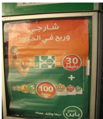
cartel de la compañía باين