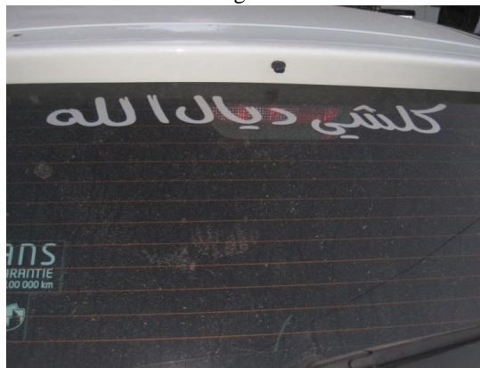
Mensaje en AM en el parabrisas de un coche aparcado en la calle

Este ejemplo es una clara manifestación de la conexión que hay entre el nivel macro de la transformación del PL y el nivel micro. Una de las contribuciones de la política lingüística en este ejemplo sería implicarla en la necesidad de pensar las políticas de construcción del PL no solo a nivel macro o nacional sino también a nivel de unidades más pequeñas como es el caso en el ejemplo nº 12. Ello nos ayudará a analizar, entender y criticar los mecanismos explícitos e implícitos presentes en las estrategias que se utilizan para la configuración y elaboración del PL.