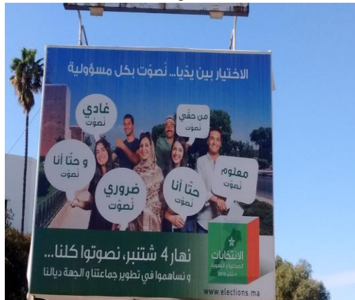
Cartel de las últimas elecciones locales y regionales de 2015 en una calle de la ciudad de Meknés