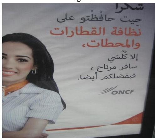
Cartel de la ONCF en la estación de tren de Meknés Al Amir

La imagen 6 corresponde al cartel oficial de la campaña nacional informativa para las elecciones locales y regionales celebradas en septiembre de 2015.