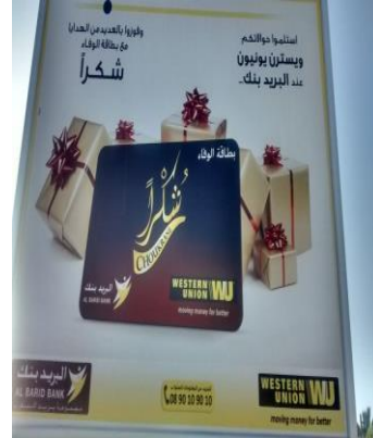
Cartel bilingüe AME e inglés de Al Barik & Western Union

En definitiva, podemos decir que este barrio es un espacio de multilingüismo y poliglosia donde las lenguas tanto locales como el francés —y en menor medida el inglés— están en una situación de contacto y también de competencia. El francés, no obstante, aún sigue siendo una lengua de distinción social y económica ya que está muy valorada en el mercado y por la nueva economía. Y tal como señalan Blommaert, Collins y Slembrouk 37 desde una perspectiva de análisis micro-sociolingüístico, tanto el contacto entre las lenguas, como la simultaneidad y la hibridez lingüística podrían enfocar las lenguas como un conjunto de recursos lingüísticos que podrían estar en situación de igualdad, o también como recursos jerárquicamente estratificados, produciendo una indexicalidad a diferentes escalas, conectados al mismo tiempo con diferentes roles de los propios hablantes. En este espacio de indexicalidad existen también diferentes escalas de autoridad/legitimidad y de restricciones en la participación para la construcción del espacio. De esta forma, según los mismos autores, el análisis del espacio y su PL como fenómeno escalar nos ofrecen nuevos datos e interpretaciones sobre la estratificación ideológica y la política de la lengua en la sociedad.