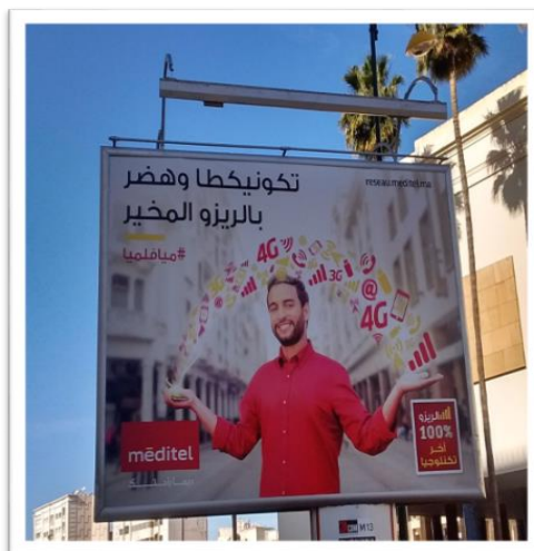
Cartel de la compañía meditel en AM

Texto en AM: meditel وهضر بالريزو المخير. مياالميا. الريزو 100 . آخر راحتك. التكنولوجيا. ديماراحتك.