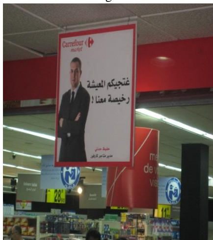
cartel en el Carrefour de la ville nouvelle (Hamria)