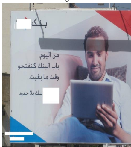
cartel de una entidad financiera

Los ejemplos 8 y 9 reflejan ambos la comunicación en el seno de lo que es la nueva economía marroquí basada en el desarrollo de una cultura de consumo. Esta nueva economía marroquí está conformada por las reformas económicas neoliberales promovidas por el Estado durante la última década. Estas reformas han