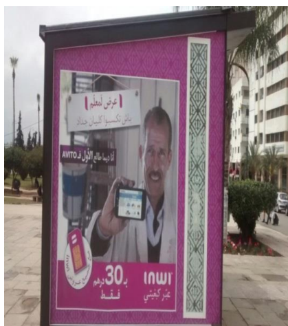
cartel de la compañía Inwi

Los ejemplos 10 y 11 es una manifestación clara de la socialización del AM en el espacio público y su recolocación como lengua escrita que podría cubrir todas las necesidades comunicativas. Los dos ejemplos corresponden a carteles de dos compañías de telefonía móvil; باين e Inwi, es decir, entrarían en la categoría de ejemplos de la nueva economía local. Ambos ejemplos están colgados en las