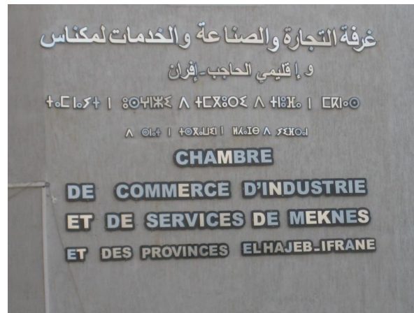
Rotulo multilingüe árabe, amazige y francés de la Cámara de Comercio, Industria y Servicios de Meknés y las provincias del Hajeb-Ifrane

Las ciudades donde se ubican los ejemplos que componen mi corpus son Casablanca, Rabat, Meknés, Asilah y otros espacios como carreteras y autopistas que unen dichas ciudades. Dicho corpus fue recogido en los últimos cinco años durante los viajes que iba realizando a dichas ciudades. He de señalar también que el proceso de recogida del corpus no fue sistemático debido a que la construcción del PL tampoco es sistemática sino es dinámica y va cambiando según los acontecimientos, las circunstancias sociales, económicas y políticas del propio espacio, de las ciudades y del país en general. Sin embargo, los ejemplos que usaremos en este artículo serán únicamente de la ciudad de Meknés, en concreto, de un barrio nuevo denominado Hamria o la ville nouvelle , un espacio que es parte de un contexto caracterizado por su dinamismo y por ser activo en términos de agentividad en la comunicación. Decidimos pues limitar el análisis solo a partir de los ejemplos procedentes de este barrio debido a lo que expondremos a continuación.