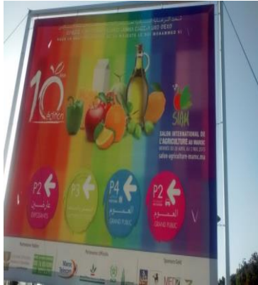
Cartel trilingüe AME, amazige y francés de la 10ª edición de la feria internacional de la agricultura