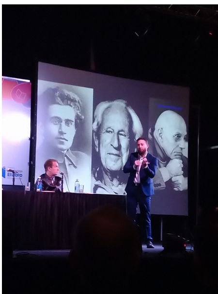
Intervención de Agustín Laje

porque va a ser muy larga y muy dura, no tiene límite de tiempo (...). No es viendo un videíto de Tik Tok (...), ni siquiera con un vídeo de YouTube. Comprométanse con una formación seria, comprométanse por la cultura; háganlo por amor propio y después por amor a una causa. Fórmense, lean. ¿Saben cuál es la diferencia entre una persona formada y otra que no está formada? La lectura. Una nueva derecha necesita mentes claras, formadas, que salgan a dar la batalla cultural (...). Hoy es muy fácil acceder a los libros, es muy simple y esa es la invitación. Vamos a dar esta batalla cultural y vamos a salvar no solo a la Argentina sino al continente. Gracias (Laje, 11/05/22).