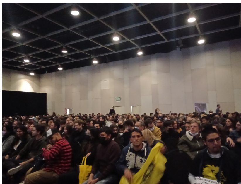
Público espera para ingresar a la presentación del libro de Javier Milei

capacidad de la sala en ambos eventos en donde Milei participó, una vez como panelista, otra como autor. En la fila de ambas jornadas se observaban grupos de amigas y amigos, parejas, también padres e hijos adolescentes y también algunos niños. Las conversaciones giraban en torno a la política, pero se diferenciaban de las registradas en los demás eventos. Aquí los jóvenes se mostraban más contentos y entusiasmados por la presencia de sus referentes, que enojados por las alusiones a los políticos a los que no adherían. Se percibía un entusiasmo por el ascenso político de Milei y una valoración a lo que consideraban la “claridad conceptual” de Laje, cuyos escritos e intervenciones eran recibidos con beneplácito por “lo que sabe y estudió con solo 30 y pico de años”, como comentó un joven contador, inmerso en el mundo de las criptomonedas, con quien compartimos la espera para el evento de Milei 17 .