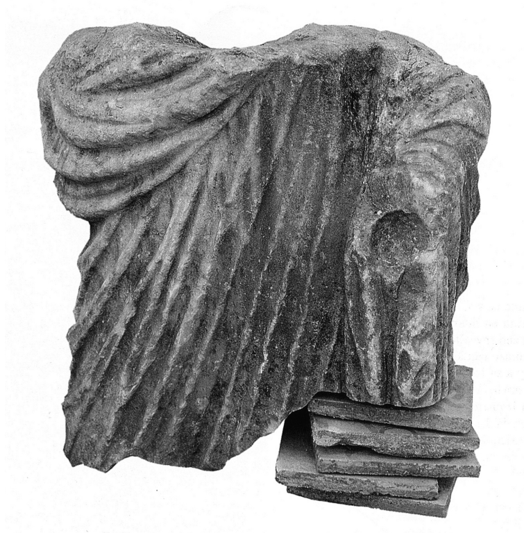
4. Togado de la Villa de San Sebastián (Raya Praena 2000).