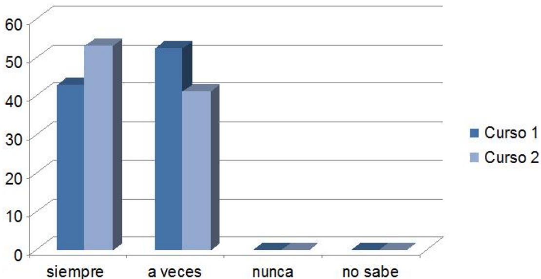
Fig.nº 3: Respuestas a la pregunta: ¿El foro le parece un medio adecuado para discutir temas de la asignatura?