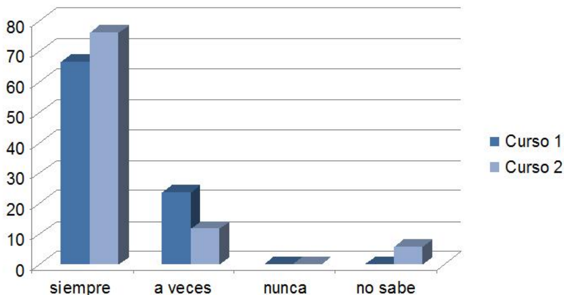
Fig.nº 5: Respuestas a la pregunta: “¿Cree que se debe continuar usando el foro como herramienta de aprendizaje?”

En las entrevistas realizadas a los alumnos, ellos expresan que la participación dentro del grupo es importante para el aprendizaje porque a partir de la lectura de las intervenciones de sus compañeros confirman lo que suponían que era correcto, o se dan cuenta que estaban equivocados, revén sus conceptos y eso les ayuda a entender mejor los temas planteados. Además, muestran satisfacción sobre el trabajo desarrollado en los foros virtuales y lo confirman cuando consideran que se debe continuar usándolo como herramienta de aprendizaje (figura 5).