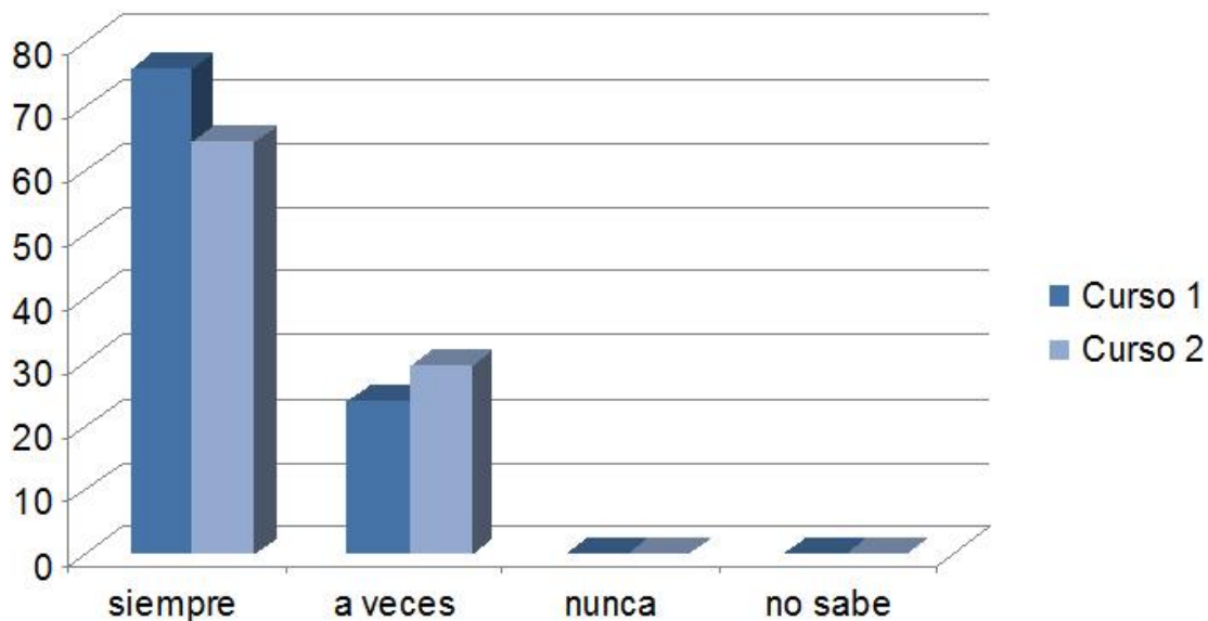
Fig.nº 4: Respuestas a la pregunta: “¿Cree que es útil el foro para completar el aprendizaje sobre los temas propuestos?”