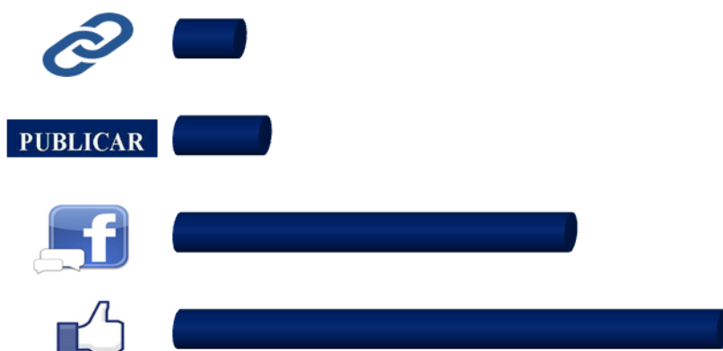
Figura 3. Intervención del alumnado

El muro del grupo fue utilizado como canal de información para compartir información –artículos, enlaces a documentales, noticias, etc.- sobre aquellos aspectos de la asignatura que suscitaban un mayor interés por parte del alumnado, como, por ejemplo, las cuestiones relativas al crimen organizado, las alteraciones neurológicas en el caso de los delincuentes violentos o el tratamiento de los delincuentes sexuales. En muchas ocasiones observamos cómo, a los recursos publicados, los alumnos respondían con otros recursos que ellos encontraban.