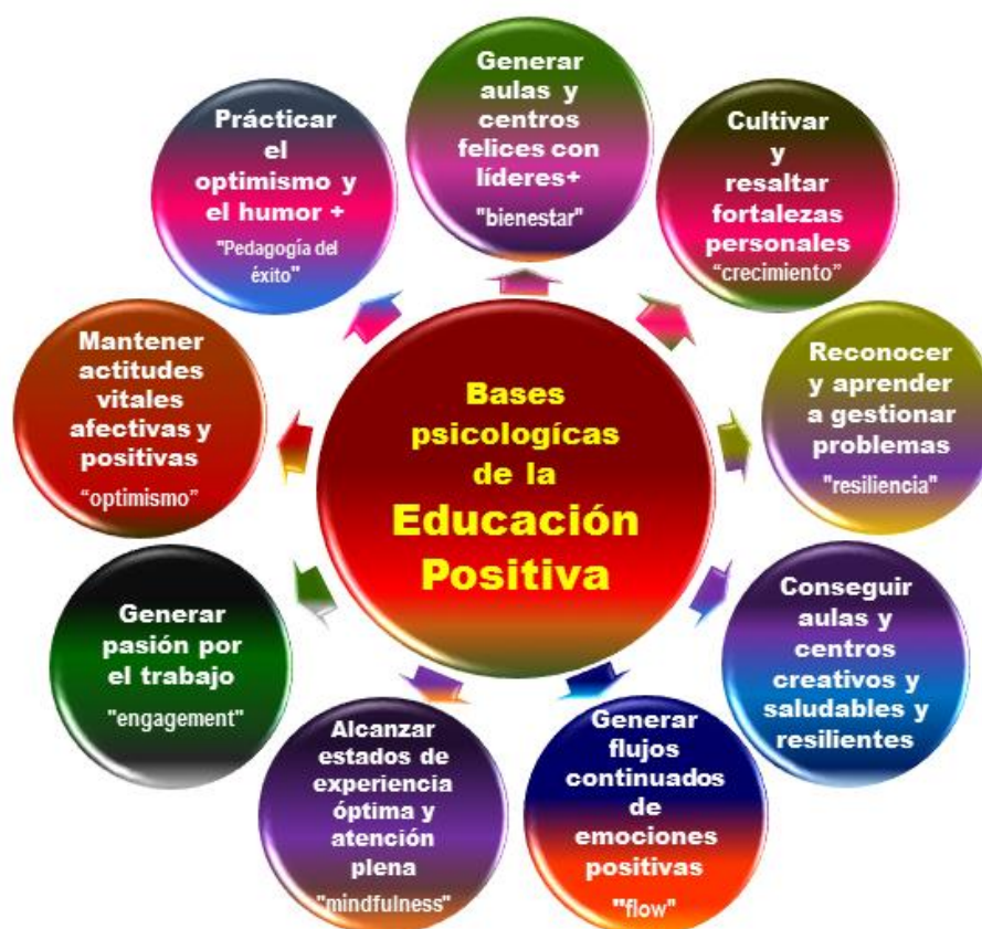
Fig. nº 2. Conceptos clave de Educación Emocional Psicología emanados de la Psicología Positiva

Ortega-Carrillo (2017) ha esquematizado a modo de síntesis -usando la metáfora visual de un átomo de estructura molecular radial- las señas de identidad de la Educación Emocional Positiva, vertebrando los grandes campos del saber que la inspiran desde la Psicología Positiva teórica y aplicada. En gráfico adjunto muestra tal vertebración conceptual.