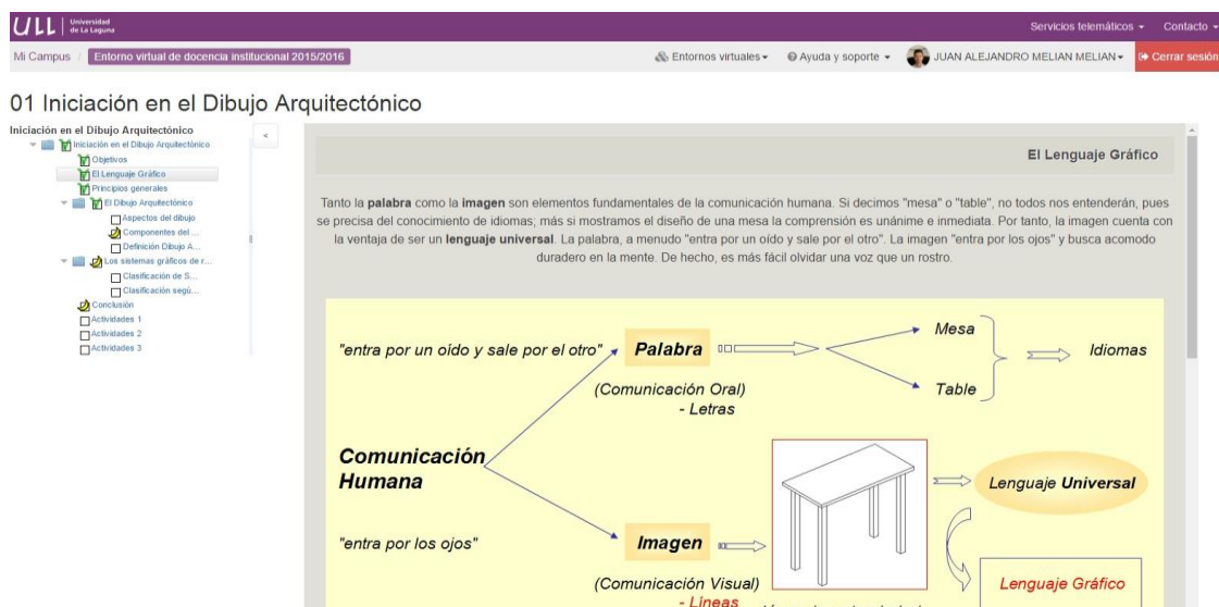
Figura 1. OA insertado en plataforma Moodle como SCORM.

Para llevar a cabo la experiencia de esta investigación se diseñaron un total de diez Objetos de Aprendizaje para aplicar en el área de Expresión Gráfica Arquitectónica. En la figura 1 se muestra la apariencia que tendrá el OA insertado en el Aula Virtual.