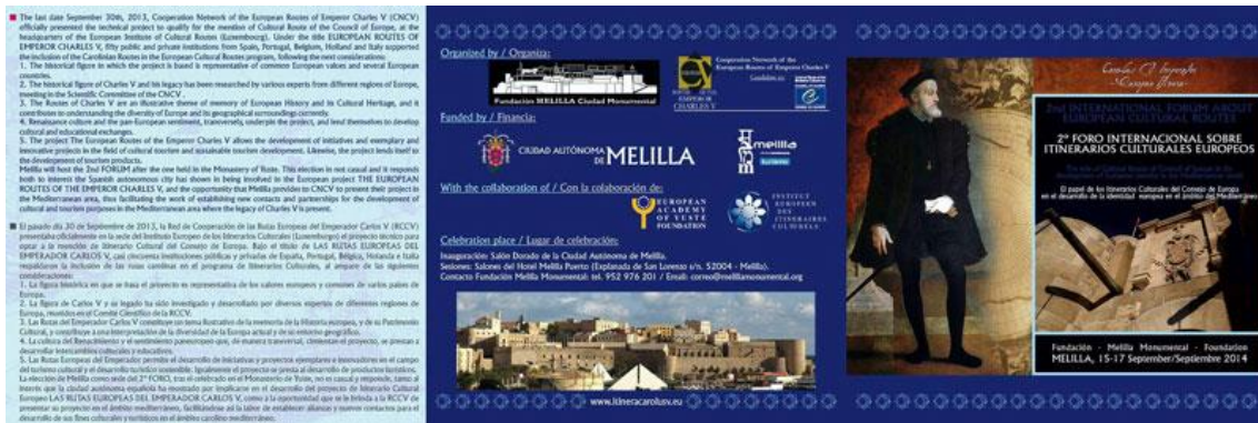
Ilustración 08. “2º Foro Internacional sobre Itinerarios Culturales Europeos”. Tríptico (Fundación Melilla Monumental, 2014).

Sobresale, asimismo, su presencia en foros de patrimonio internacionales, como: la “Red Internacional de Ciudades Europeas de la Cultura” (Tours, 2007) 69 , “Red Internacional Mediterráneo Nostro”, con sede en Sicilia (2007) 70 ; “Red Art Nouveau Network” (2012), “Red AVEC” — Alliance de Ville Européennes de Culture — (2013); “Red de Cooperación de las Rutas Europeas del Emperador Carlos V” (2013) 71 , organizando, en este último caso, el 2º Foro Internacional sobre Itinerarios Culturales Europeos (15-17 septiembre de 2014) [Ilustración 8].