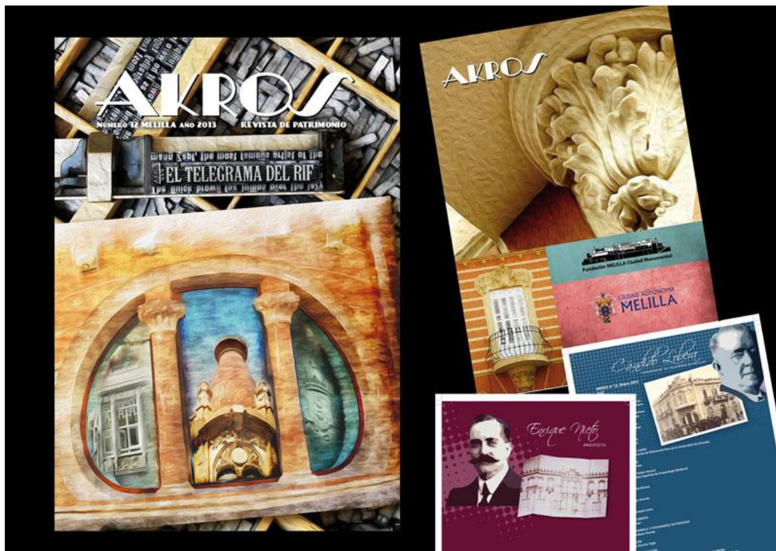
Ilustración 05. Revista Akros nº 12 (2013). Composición de portadas (Carlos Santiago, 2013).