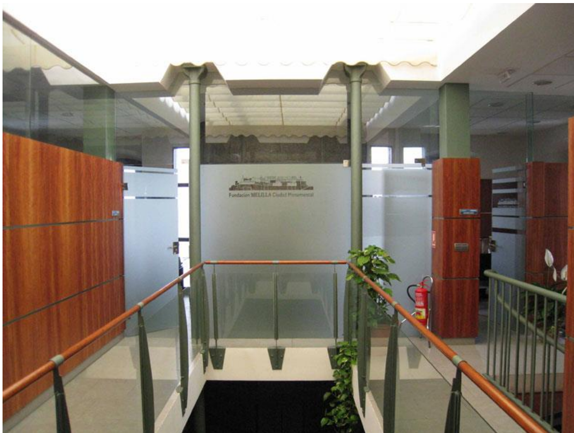
Ilustración 03. Fundación Melilla Ciudad Monumental. Interior.