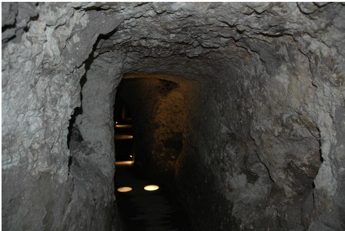
Ilustración 04. Galería del Baluarte de San José Bajo. Interior.