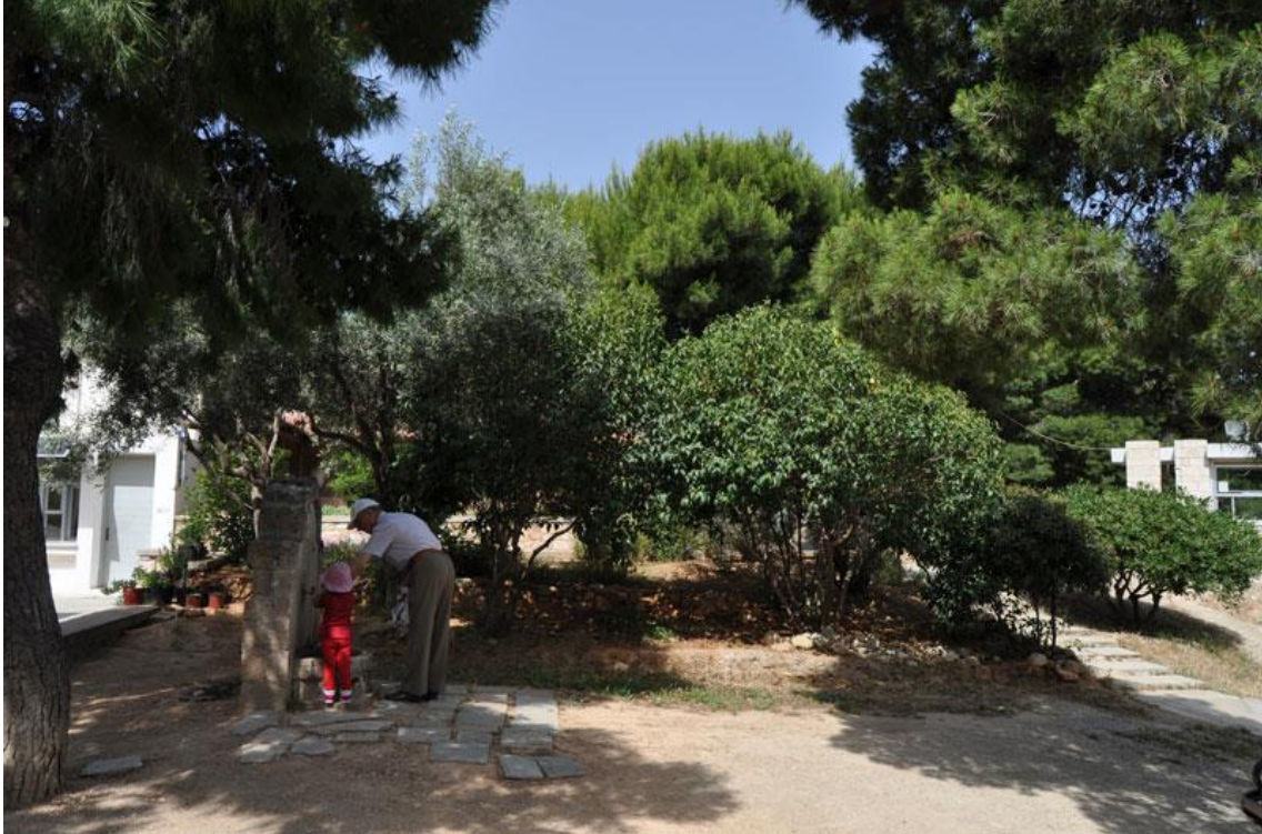
Ilustración 05. Fig. 5: Área arqueológica del Keramikos. Elaboración propia.

El área arqueológica se asienta entre los barrios del Keramikos y Ermou, un tanto aislado del centro histórico y del recorrido cultural y turístico que marca el entramado urbano en torno al Acrópolis. El hecho de estar en el límite entre la ciudad histórica y la zona de expansión urbanística ha favorecido la buena conservación del yacimiento en lo que se refiere a la protección de su perímetro, pero ha conllevado que fuera el más afectado por la polución y la contaminación acústica. Estos problemas han intentado solventarse en los últimos años con la rehabilitación de los márgenes de las vías del metro y creando áreas verdes que comunican los barrios con el centro histórico a través de recorridos exentos de tráfico rodado. Ahora bien, lo cierto es que debido al período de crisis que atraviesa la ciudad y la proximidad al conflictivo barrio de Ermou la zona, quizá por no dotarse de otro tipo de usos, más allá de ser un comunicador de barrios y dar acceso al parque arqueológico, es insegura en ciertos momentos del día.