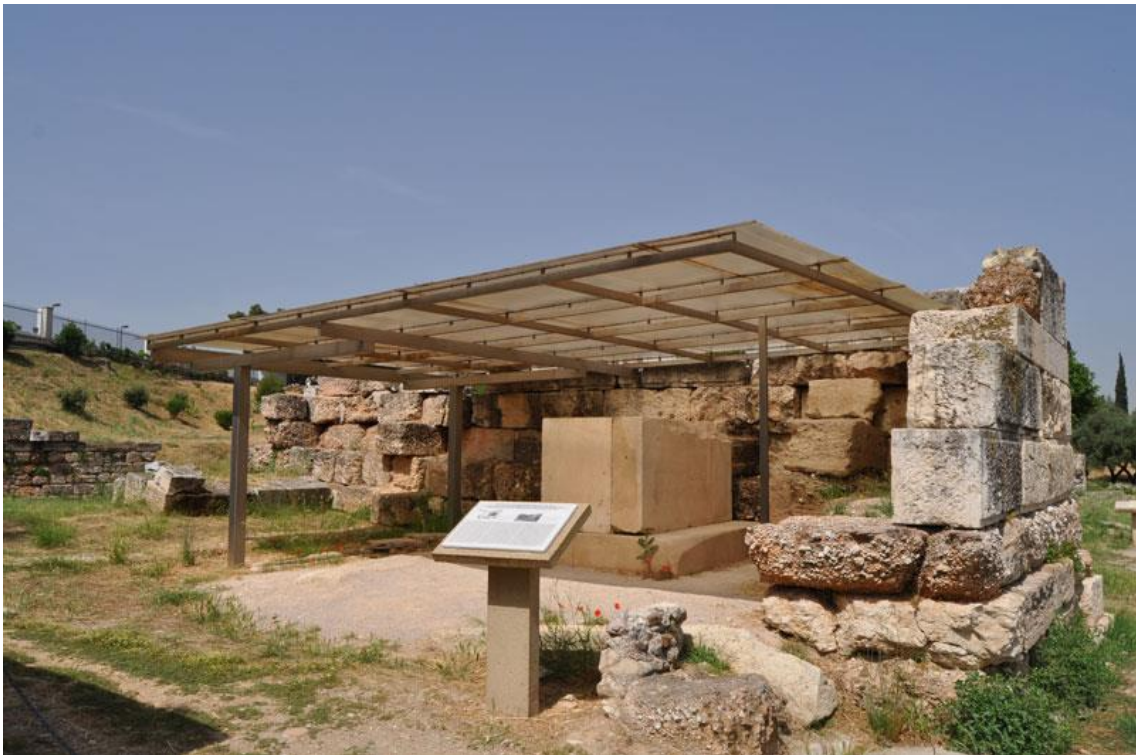
Ilustración 06. Fig. 6: Cubiertas de protección de estructuras clásicas en el área arqueológica del Keramikos. Elaboración propia.

Entre 2003 y 2004 el edificio fue renovado, como sucede con los museos que estudiaremos más adelante, con motivo de la celebración de los Juegos Olímpicos bajo la supervisión de la Escuela Arqueológica Alemana con la colaboración del Departamento de Arqueología Clásica. Ésta consistió en una nueva disposición museográfica y museológica contemporánea (siempre dentro de la exposición por periodos cronológicos característica de la escuela alemana). Arquitectónicamente se cerró el atrio mediante una estructura acristalada piramidal que permite la entrada de luz a las salas, además de ampliar el espacio museográfico; se renovó la zona de los baños situados junto al depósito; las conducciones eléctricas y los sistemas de cierre. Recientemente se ha cambiado el tejado y añadido el pórtico en forma de “l” de la entrada.