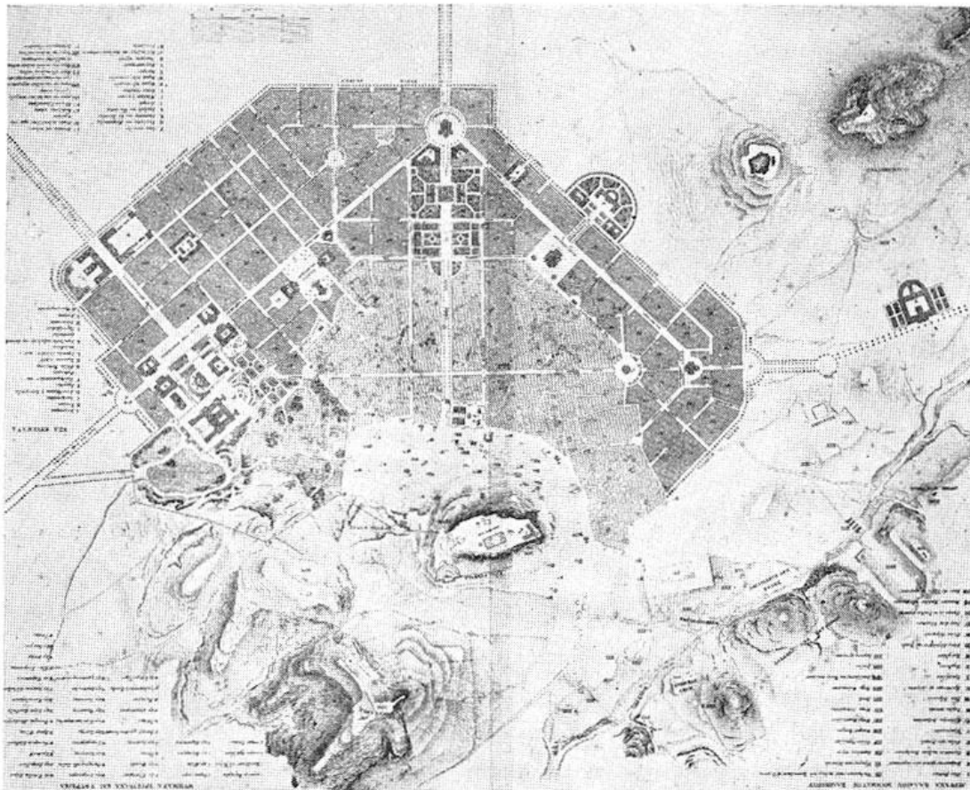
Εἰς. 160. Τὸ ὑπὸ τοῦ Klenze ἐκπονηθὲν σχέδιον τῆς νέας πόλεως (1834), κατὰ παλαιὰν χαλκογραφίαν.

Ilustración 04. Fig. 4: Proyecto de desarrollo urbano de la ciudad de Atenas. Leo Von Klenze, 1846. Extraído de: Kallivretakis, Leonidas. Athens in the 19th century: From regional town of the Ottoman Empire to capital of the Kingdom of Greece. [en línea].[consulta 20.11.2014]. - http://www.eie.gr/archaeologia/gr/chapter_more_9.aspx