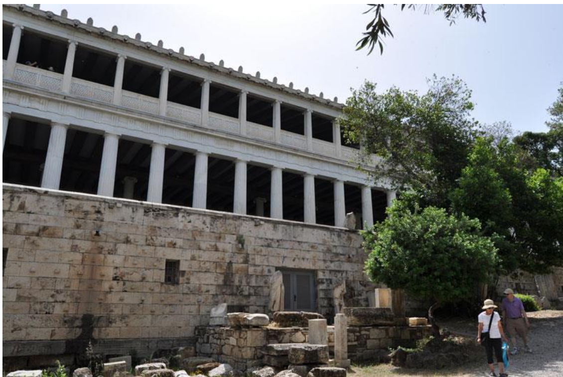
Ilustración 8. Imagen exterior de la Stoa de Atalo.

En esta ocasión, se repite el binomio compuesto por la dirección de una escuela arqueológica extranjera y la creación de un museo en el que mostrar las piezas halladas. Ahora bien, mientras que la Escuela Arqueológica Alemana decide construir un edificio de nueva planta en un solar libre de restos arqueológicos, la Escuela Americana se decide por reconstruir la Stoa de Atalo.