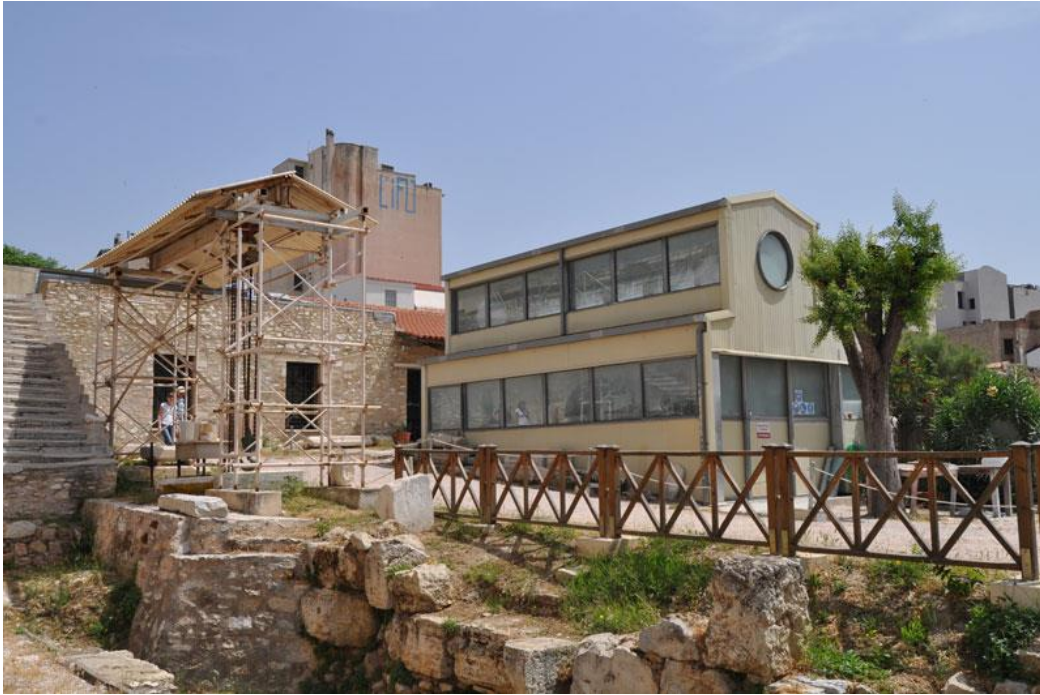
Link 4. Exterior del Museo de la Biblioteca de Adriano.