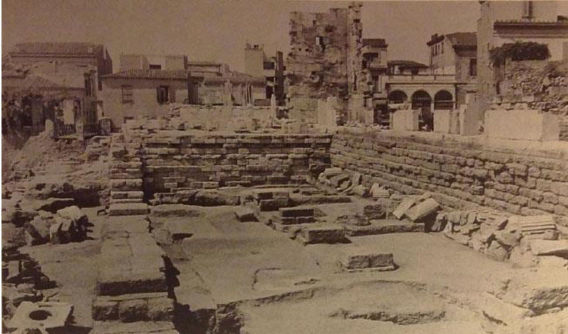
Ilustración 7. Cimentación arqueológica de la Stoa de Atalo previa a la restauración. Extraído de SARAGA, Nicoletta (2011). The Stoa of Attalos. The Museum of the Ancient Agora . Athens: Hellenic Ministry of Culture and Tourism.

El centro de la vida pública y política en Atenas en época griega es el ágora. Las excavaciones comenzaron en 1859 de manos de la Sociedad Arqueológica Griega en torno a la Iglesia de los Santos Apóstoles. En 1924, se produce la cesión de la dirección y excavación del área a la Escuela Americana de Estudios Clásicos de Atenas (ASCSA) que, junto al Gobierno Griego, coordina a día de hoy tanto las excavaciones como las actividades realizadas en el sitio. Los primeros objetivos de la ASCSA fueron la realización de catas, la delimitación del área arqueológica y la expropiación del suelo ocupado por el perímetro arqueológico para crear un plan de excavación arqueológica a largo plazo (Townsend, 1995).