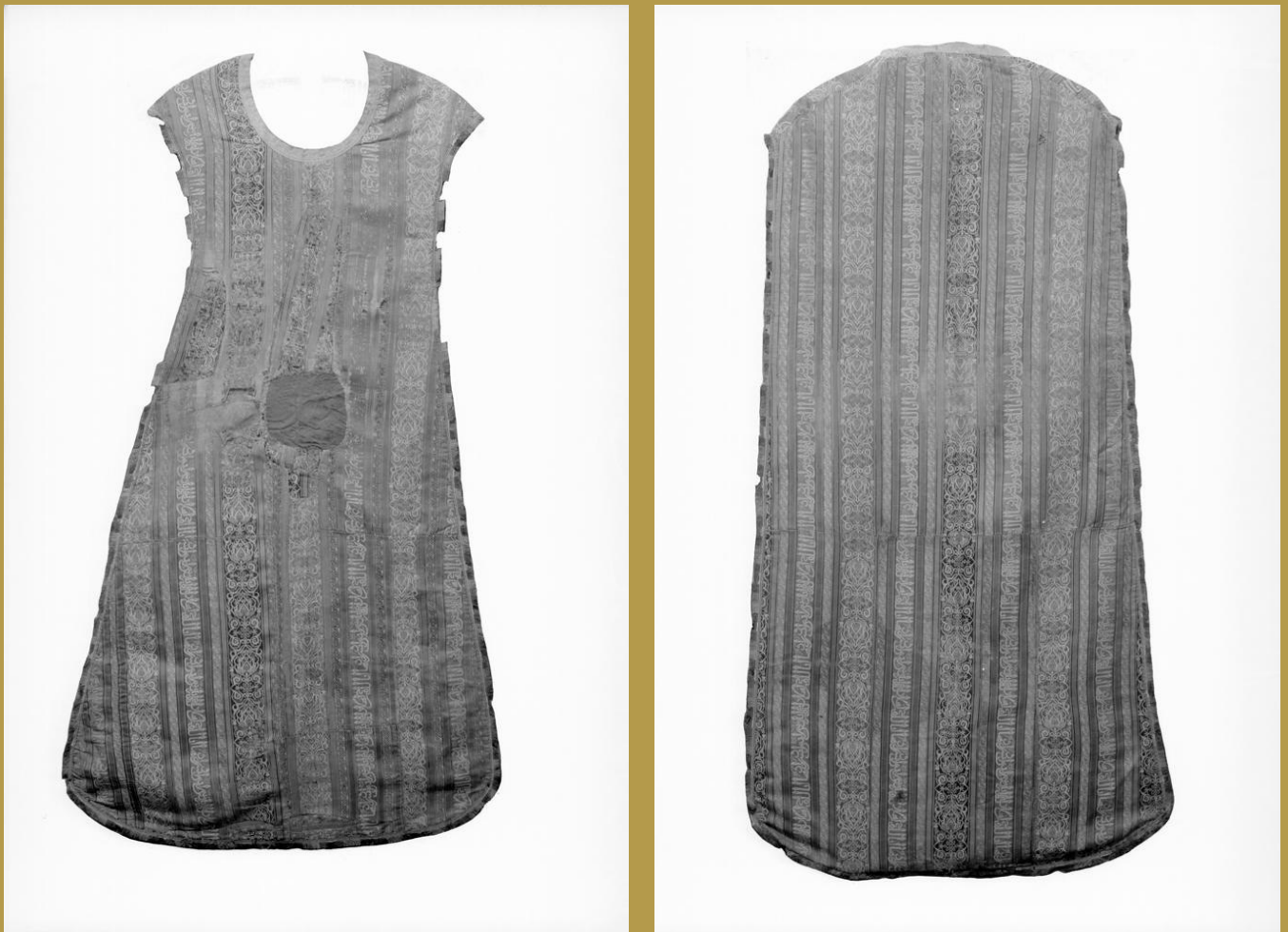
FIGURAS 2 & 3.

En la Fototeca del Instituto del Patrimonio Cultural de España (Madrid), se conservan dos imágenes tituladas “Casulla” pertenecientes al archivo Moreno, que es uno de los más importantes en cuanto al patrimonio material se refiere [Figuras 2-3] 6 . Anteriormente conocido como el Archivo de Arte Español, su origen se remonta a 1893. Fue entonces cuando Mariano Moreno García (1865-1925) comenzó a fotografiar bienes muebles e inmuebles en el territorio peninsular, muchos de los cuales hoy en día ya no existen. Sin embargo, gracias a su inestimable trabajo y al de su hijo, Vicente Moreno Díaz (1894-1954), tenemos evidencia de ello. Esta colección fue vendida tras el fallecimiento de este último.