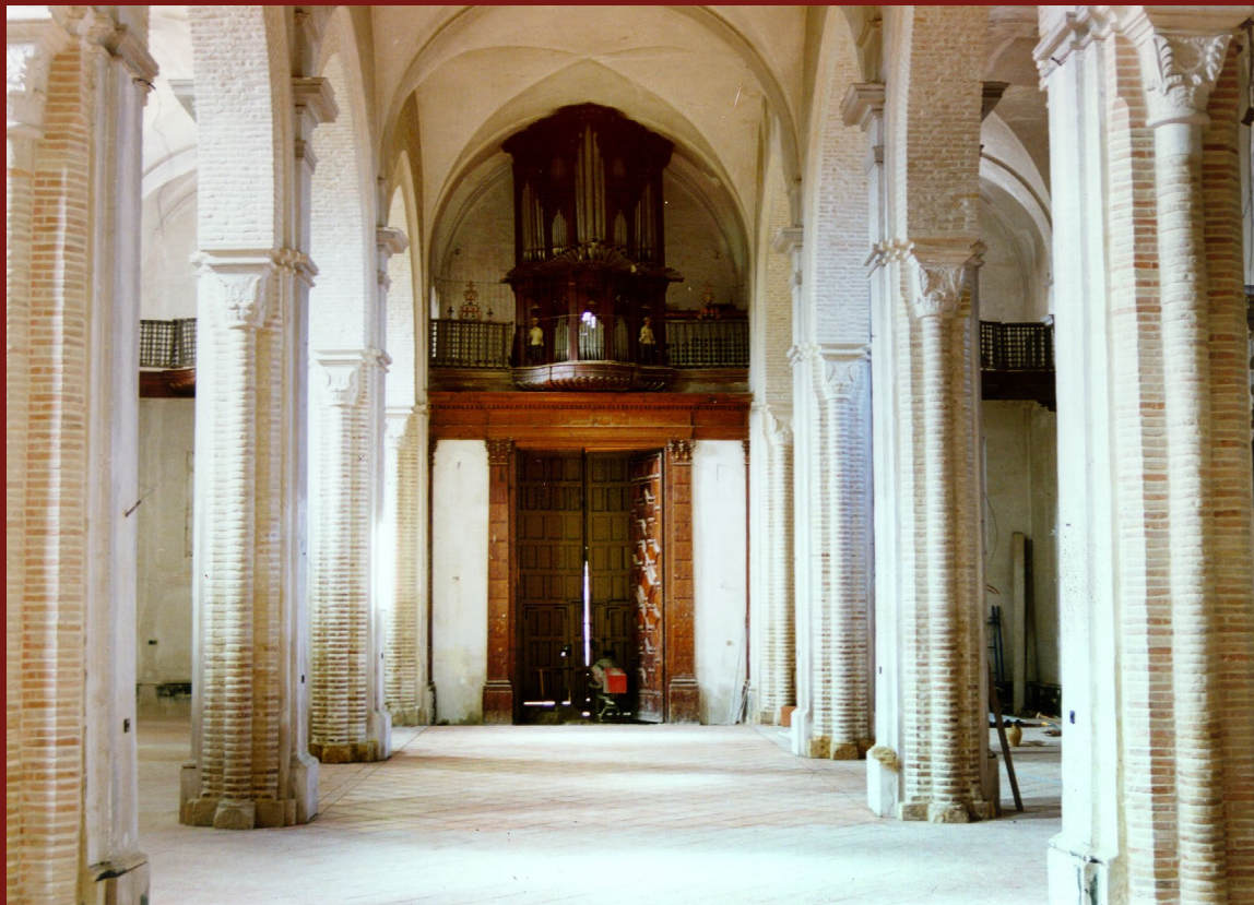
FIGURA 8. Vista de la iglesia de San Gil sin el coro