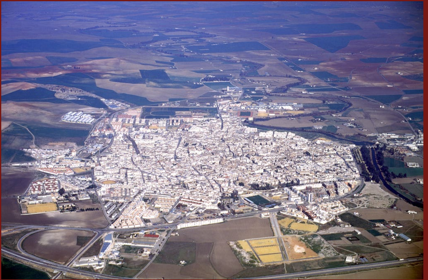
FIGURA 1. Vista aérea general de Écija

Palacios como el de Benamejé o Peñaflor, iglesias como Santa María, conventos como los Descalzos, edificios públicos y casas-palacio se construirán durante el siglo XVII, pero especialmente en el siguiente.