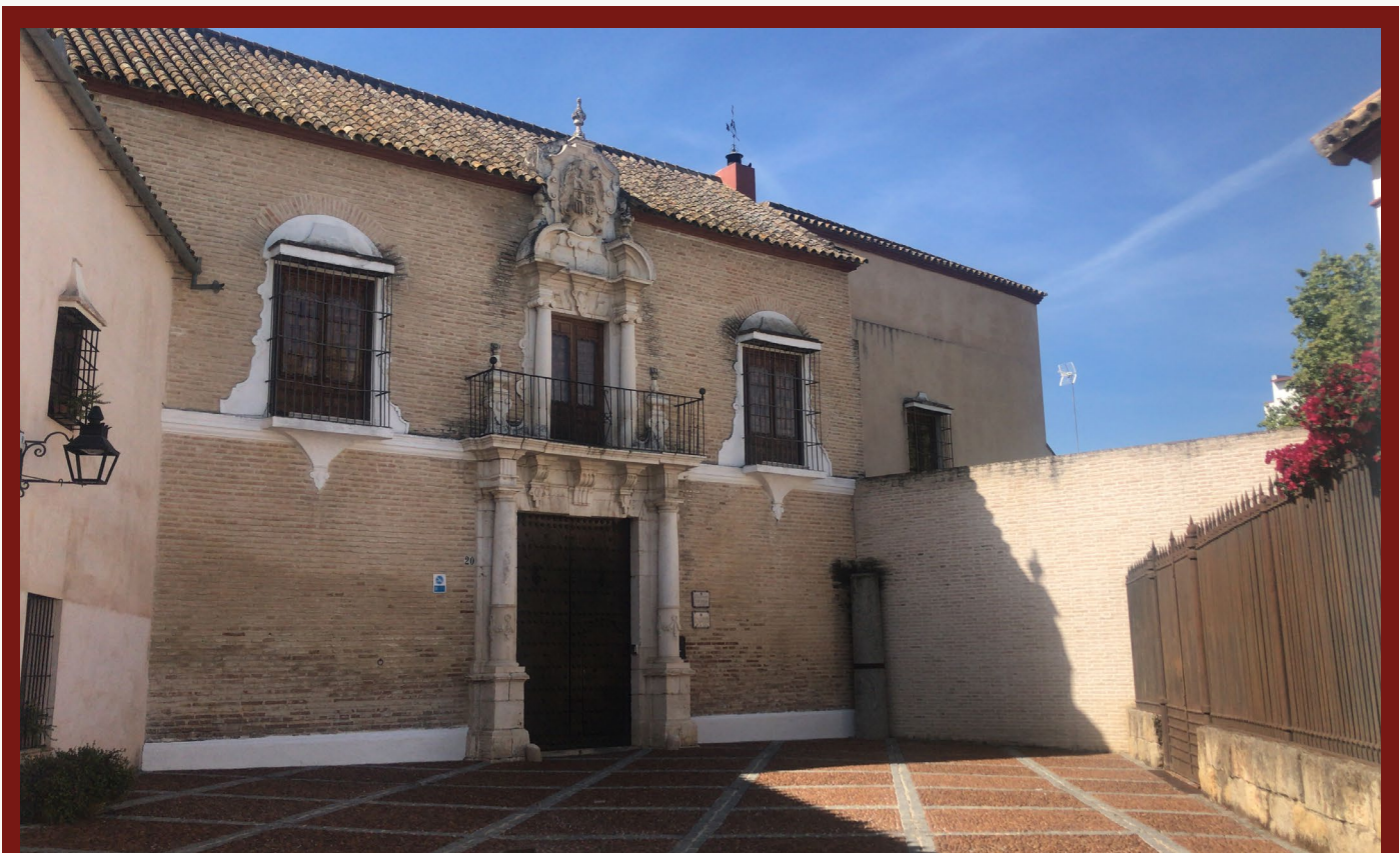
FIGURA 9. Palacio de Cárdenas y Prado Castellano