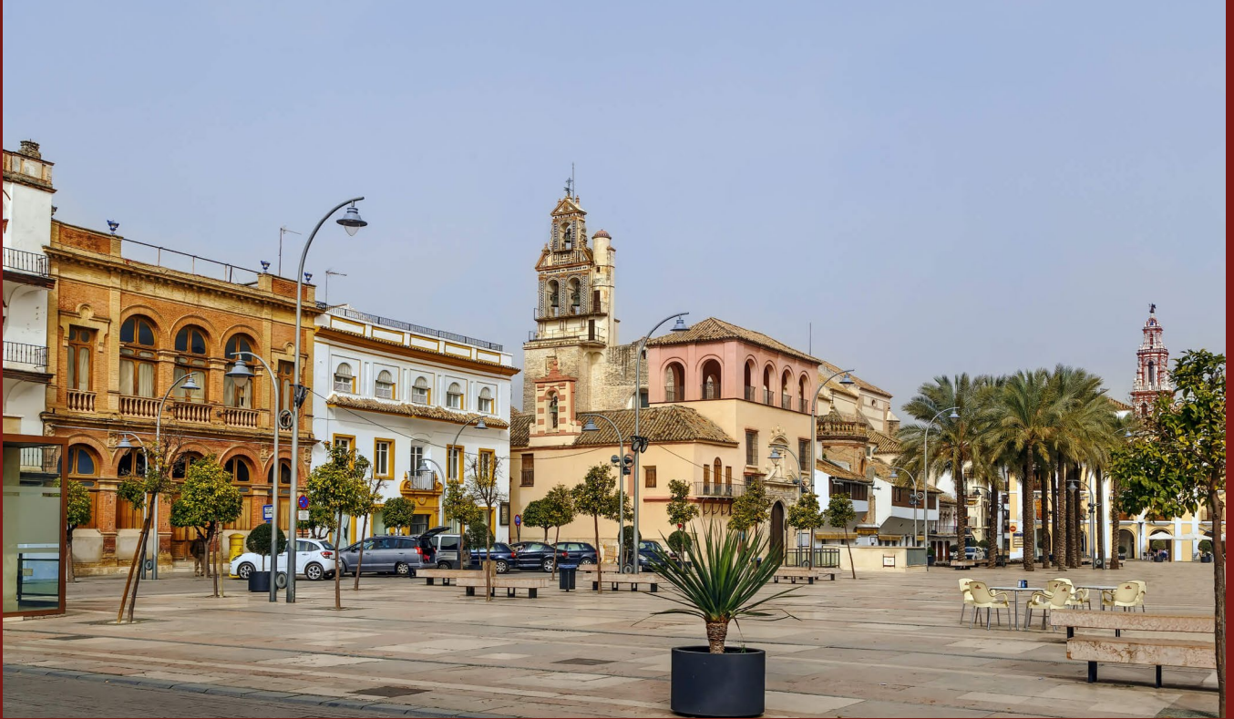
FIGURA 4. Plaza de España "El Salón" (Écija) en la actualidad