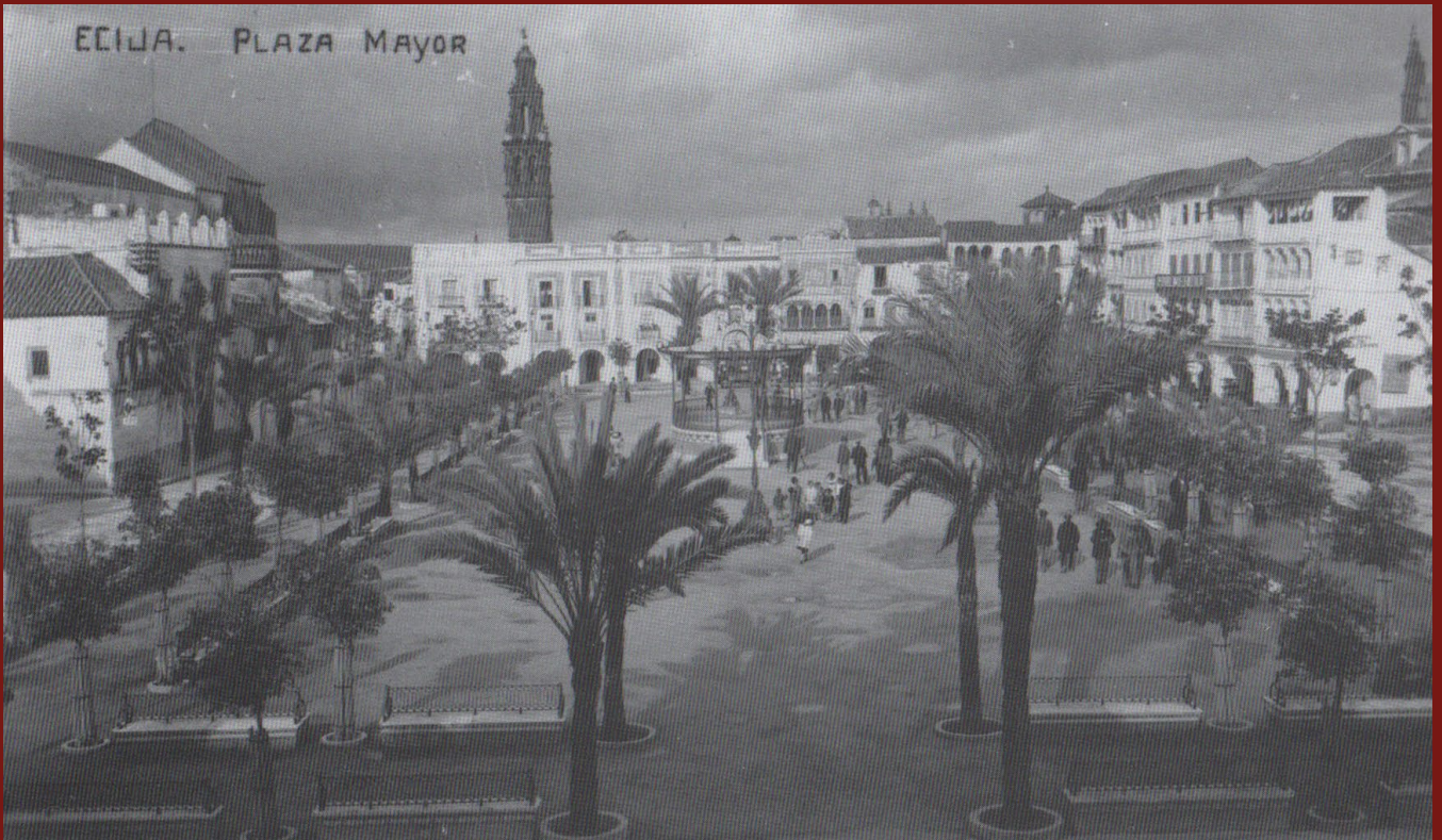
FIGURA 5. Plaza de España "El Salón" (Écija), fotografía a principios del siglo XX