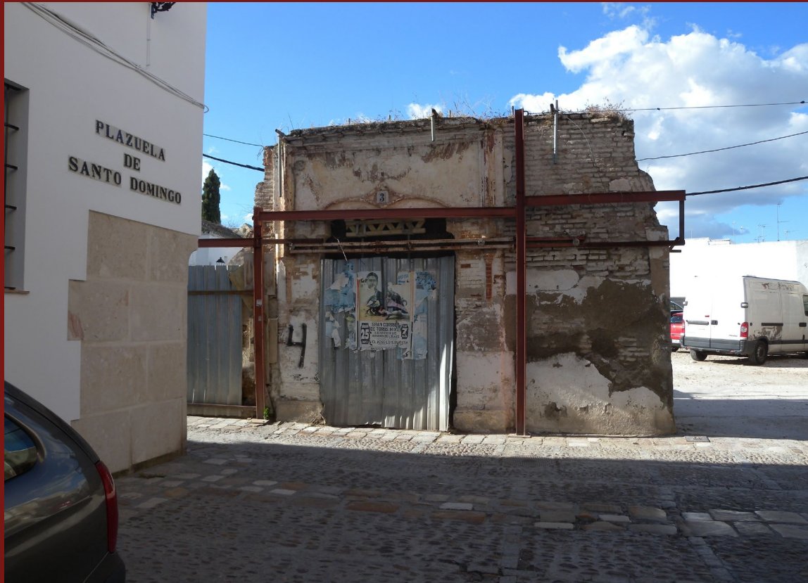
FIGURA 7. Portada gótica de la casa palacio de los Zayas en la plazuela de Santo Domingo