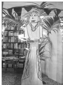
Técnica mixta: collage y dibujo al natural de los gigantes

Como cantaba Joan Manuel Serrat, “nacimos en el Mediterráneo”; el conocimiento en medio social se dirige precisamente a esta circunstancia. Conocer la cultura mediterránea, los países que la integran, donde se sitúan, las características