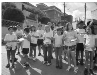
Timbals y timbalers

- Realizamos bailes y danzas, dando protagonismo especialmente a la sardana.