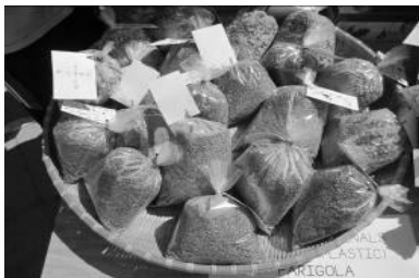
Bolsas de hierbas medicinales