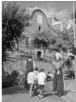
Rua de gegants i cabezudos