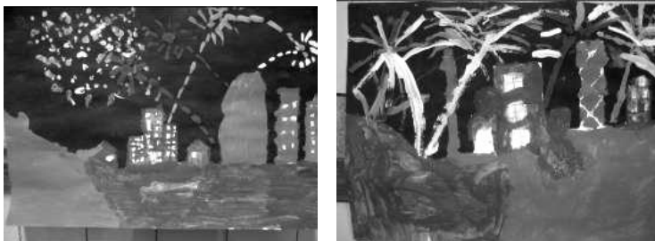
Barcelona + Mercè + noche = castillos de fuegos y música