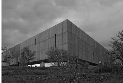
Museu do Coa

É preciso acreditar no turismo, e tal como foi já referido anteriormente, uma das portas abertas ao mundo para um turismo sustentado e sustentável, é de facto o Museu do Coa. Conjugado com as gravuras rupestres, o Museu é um hino à realidade arquitetónica deste país. É necessário apoiar este projeto único para o país e para a preservação da memória da Humanidade. Um museu inserido nas entranhas das encostas do Douro e do Coa, com mais de 800 metros quadrados de área de exposição cultural, o Museu permite fazer uma viagem através da história e verificar o testemunho de diferentes homens e mulheres que deixaram a sua marca nas rochas, desde há cerca de 25000 anos até à contemporaneidade.