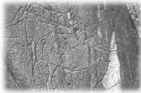
Gravura rupestre do Vale do Coa. Figuras sobrepostas – Penascosa

aos fenômenos naturais de degradação, as figurações ao ar livre estão hoje menos representadas do que as pinturas e gravuras em grutas. Em regiões como o Vale do Coa, onde as condições naturais foram mais favoráveis, a regra geral não se aplicou. Por outro lado, a distribuição das gravuras ao longo do rio numa extensão de quase duas dezenas de quilômetros permite-nos pensar que estamos perante um autêntico santuário ao ar livre. A exposição preferencial das gravuras a nascente e a associação dos animais ao rio, sugere uma veneração das águas do rio, que seria sagrado (Gomes, 1994: 4-9).