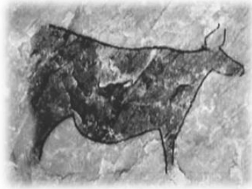
Gravuras rupestres do Vale do Coa