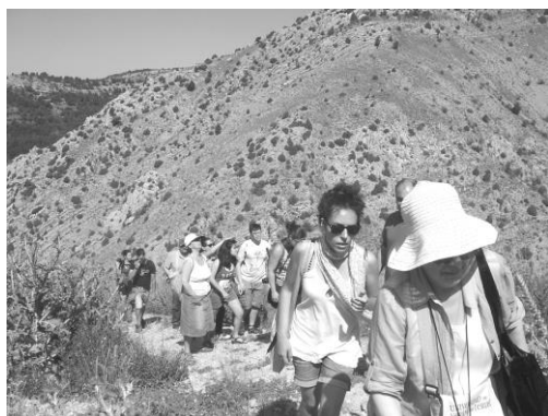
Figura 1. Alumnos del I Curso de Pintura Miradas y Territorio. Subida al castillo de Alcalá de la Selva (Teruel, 2011)

“En estas excursiones se atiende al desarrollo físico de los alumnos por medio de largas caminatas, ascensiones y ejercicios varoniles que dan vigor al cuerpo, al mismo tiempo que energía moral y temple al alma; estudian directamente los objetos naturales y el territorio como teatro vivo de la actividad humana (...)” (Torres Campos, 1882: 188).