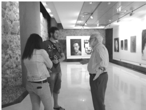
Figura 7: Sala de Exposiciones de La muralla, Edificio Carmelitas. Exposición EGO, 2014.

El resultado final fue totalmente satisfactorio y tuvo repercusión en la prensa local. La calidad del trabajo presentado era excelente, sobre todo teniendo en cuenta que la mayor parte de los participantes eran alumnos de segundo curso. La dedicación que prestaron a este ejercicio en el aula (la ejecución material de sus autorretratos) fue extraordinaria incentivados por la idea de una muestra posterior. La gestión y coordinación que llevaron a cabo fuera del aula se valoró por mi parte muy positivamente como profesora de la asignatura y fue tenida en cuenta para la evaluación de los resultados de aprendizaje.