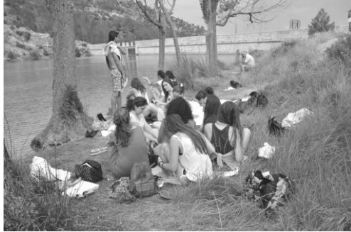
Figura 2. Alumnos del III Curso de Pintura Miradas y Territorio. Descanso en el pantano de Rubielos de Mora (Teruel, 2015)

Hoy en día abunda la bibliografía referida al paisaje como experiencia estética derivada de la observación y la experimentación directa mediante el acto físico de andar. Arquitectos, artistas plásticos, poetas y filósofos coinciden en valorar el paseo como hecho indispensable para definir la idea de paisaje.