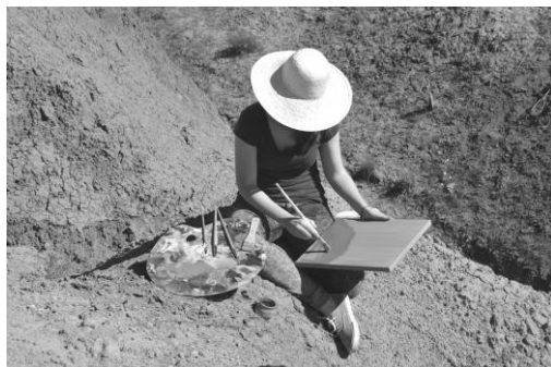
Figura 3. Alumna en el Parque de las Arcillas, Teruel, 2015.