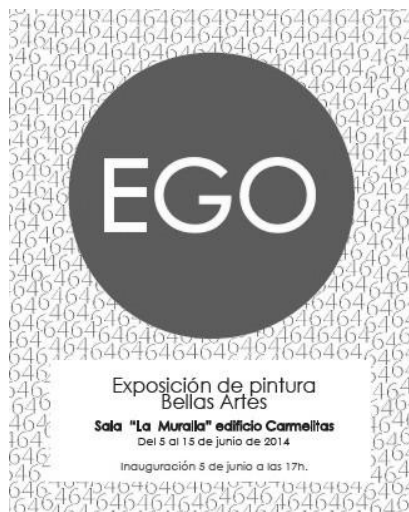
Figura 6. Cartel de la exposición EGO de alumnos de Bellas Artes, 2014.

Gestionar, diseñar y montar una exposición con los trabajos realizados durante el curso, o con el resultado de un trabajo determinado de una o más asignaturas se convierte en un recurso didáctico cada vez más necesario. A continuación describiré la experiencia llevada a cabo por los alumnos de segundo, tercer y cuarto curso en torno a una exposición que tuvo como tema el autorretrato. Dicha exposición titulada EGO , se celebró en la Sala de Exposiciones de La Muralla del Gobierno de Aragón, en el centro de Teruel, en la primavera de 2014.