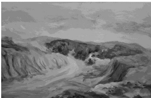
Figura 5. Uno de os trabajos del alumnado en el Parque de las arcillas, Teruel, 2014. Óleo sobre tabla, 30x40 cm.

La experiencia siempre es positiva para el alumnado, de hecho, es raro el absentismo en este tipo de actividades al aire libre. La predisposición por parte del alumnado es total, a pesar de la incomodidad que supone acarrear los bártulos necesarios para la actividad práctica, pues los caballetes de campo, pinturas, lienzos o tablillas no son fáciles de transportar.