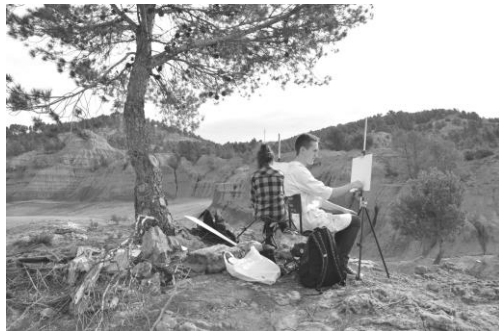
Figura 4. Alumnos en el Parque de las Arcillas, Teruel, 2015.

Un mismo espacio es percibido por cada persona de modo diferente, porque como dije al principio el paisaje es el conjunto de estímulos, sentimientos y vivencias que cada individuo experimenta en el lugar.