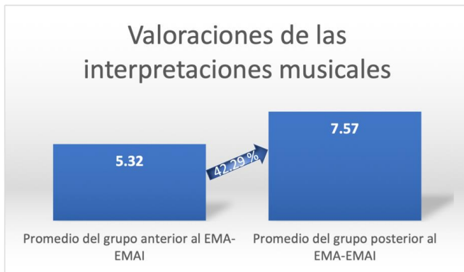
Figura 2. Valoraciones de las interpretaciones musicales.

Respecto a la valoración cuantitativa de las interpretaciones musicales del grupo de estudio en el periodo de esta investigación, se ha registrado un incremento general con relación a la calidad de las performances registradas del alumnado, conforme se puede apreciar en la Figura 2.