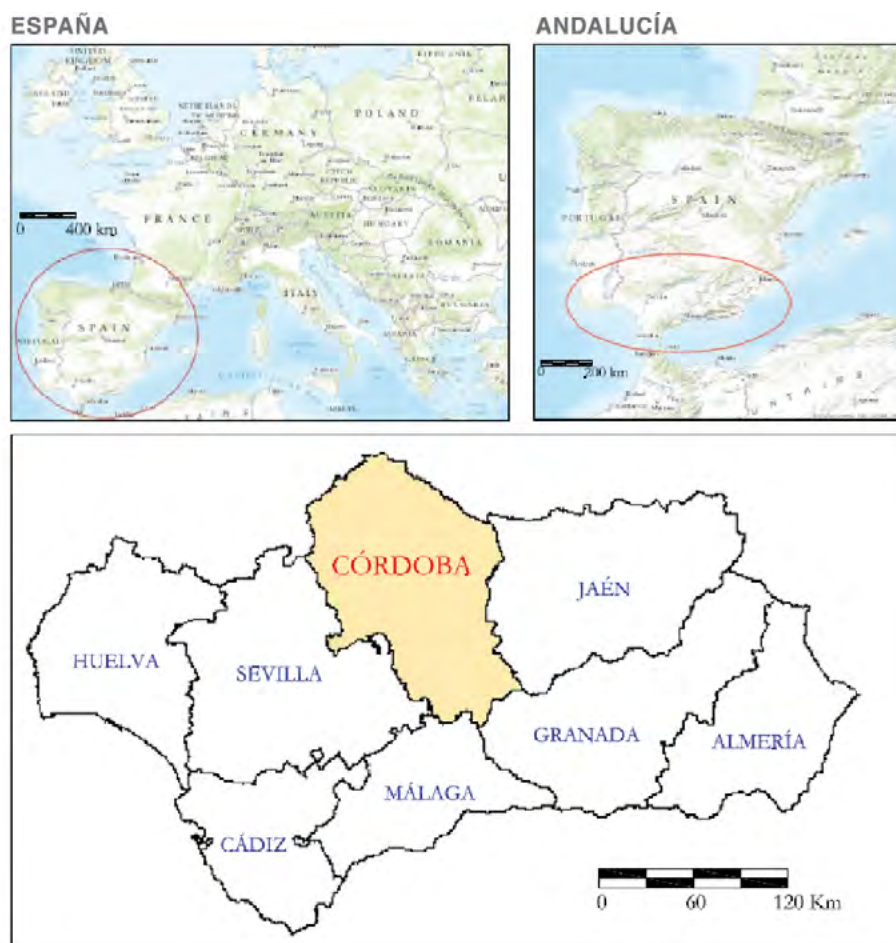
Mapa 1. Plano de situación de la provincia de Córdoba (España).

Fuente: Elaboración propia. Datos Consejería de Medio Ambiente. Junta de Andalucía