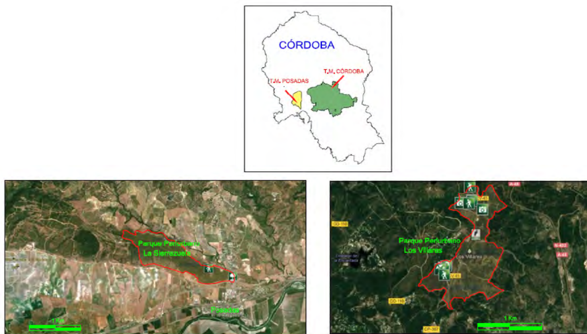
Mapa 2. Planos de los PP “La Sierrezuela” y “Los Villares” en el término municipal de Córdoba (España)