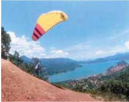
Foto 6 y 7. Diversificación turística