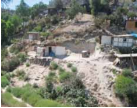
Foto 4 y 5. Dicotomía social en Valle de Bravo, México