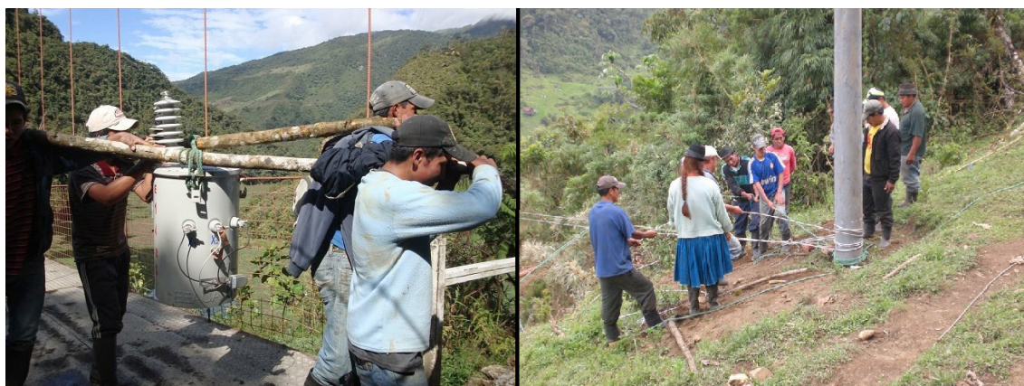
Imagen 1. Trabajo comunitario para la construcción de obras de electrificación en zonas de difícil acceso

Fuente: Empresa Eléctrica Azogues. Comunidad Palmira, parroquia Rivera.