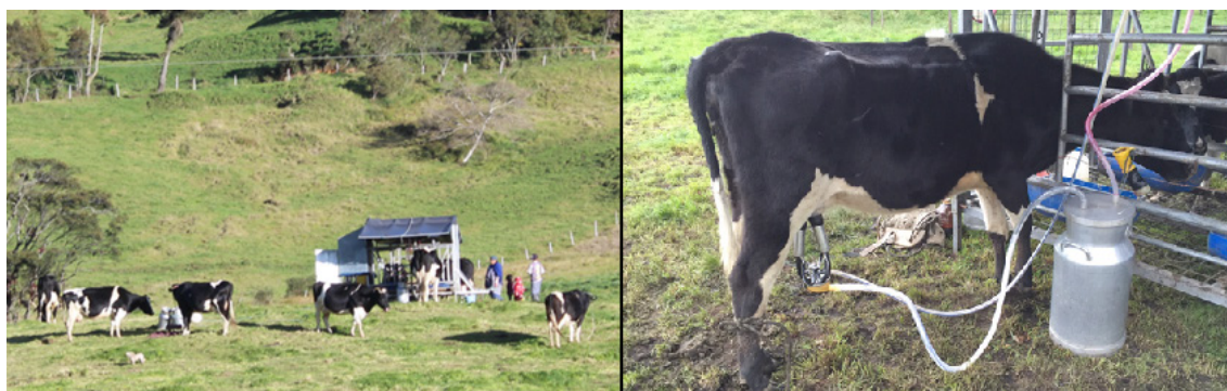
Parroquia Taday, septiembre 2013.

Por otro lado, la segunda mejora productiva en el ámbito de la ganadería se vincula con la instalación de sistemas de almacenamiento en tanques de enfriamiento que incrementan las condiciones de higiene y conservación del producto. De esta manera, se garantiza la calidad de la leche, lo cual favorece la producción local. Estos centros de acopio, que benefician a varios productores de la zona, han surgido como resultado de procesos organizativos que generan mejores condiciones de negociación con los intermediarios, y además, permiten la posibilidad de una vinculación directa con las plantas procesadoras de lácteos. De esta manera, esta mejora productiva supone también lograr oportunidades de comercio justo para el beneficio colectivo. Finalmente, esta dinámica, aumenta los ingresos de los productores y, por ende, de las familias, fortalece las estructuras organizativas y motiva a los productores a generar nuevas actividades que den valor añadido a sus productos.