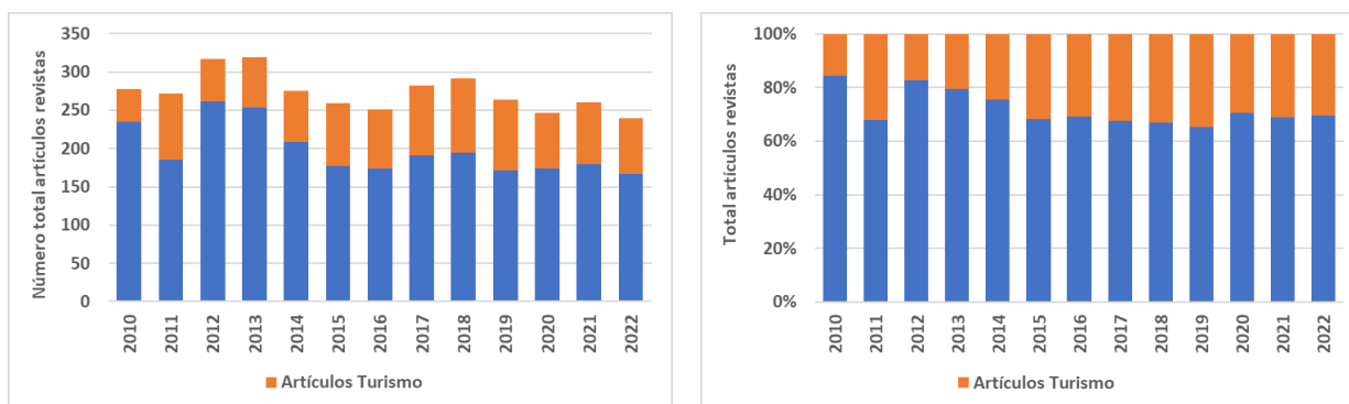
Figura 1. Publicación de artículos de temática turística sobre el total de artículos publicados en las revistas analizadas. Datos absolutos (izquierda) y datos relativos (derecha).

La revisión de la producción bibliográfica realizada sobre 6 revistas españolas de Geografía y/o Turismo ( Boletín de la Asociación Española de Geografía , Scripta Nova , Documents d'Anàlisi Geogràfica , Cuadernos de Turismo , Investigaciones Turísticas y Papers de Turisme ) para el período 2010-2022 señala la publicación de 982 artículos de temática turística entre los 2556 artículos totales publicados en ellas (el 38,4%) (Figura 1). De estos 982, tan solo 24 artículos versaban sobre mujer o incorporaban el enfoque de género en su análisis (el 2,4% sobre los artículos de temática turística) (Figura 2). La revista que ha publicado un mayor número de contribuciones en esta línea durante el período de estudio es Cuadernos de Turismo (el 41,6%), siendo también la que ha mantenido una presencia más regular de este tipo de aportaciones a lo largo de los años. En 2019, con un monográfico especial sobre Igualdad de género en turismo , la revista Papers de Turisme editaba el que sería su último número. Ninguna otra revista de las analizadas a dedicado un número especial a esta cuestión durante el período 2010-2022, si bien con anterioridad la revista Documents d'Anàlisi Geogràfica ostenta el hito de haber dedicado el primer monográfico a género (no necesariamente vinculado al turismo) en una revista española de Geografía.