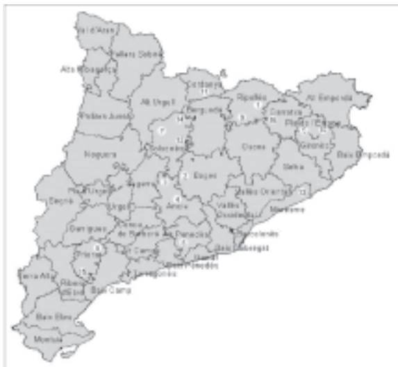
Mapa 1. Casas de Turismo Rural entrevistadas en Cataluña*