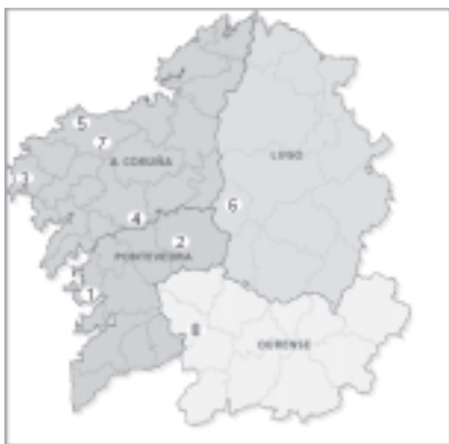
Mapa 2. Casas de Turismo Rural entrevistadas en Galicia*