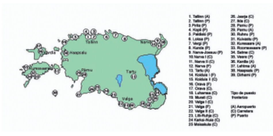
Mapa-esquema 2: Estaciones fronterizas de Estonia