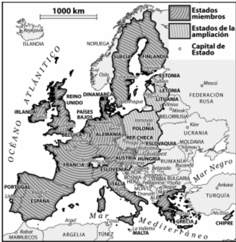
Mapa 1: Los estados y las fronteras de la Unión Europea