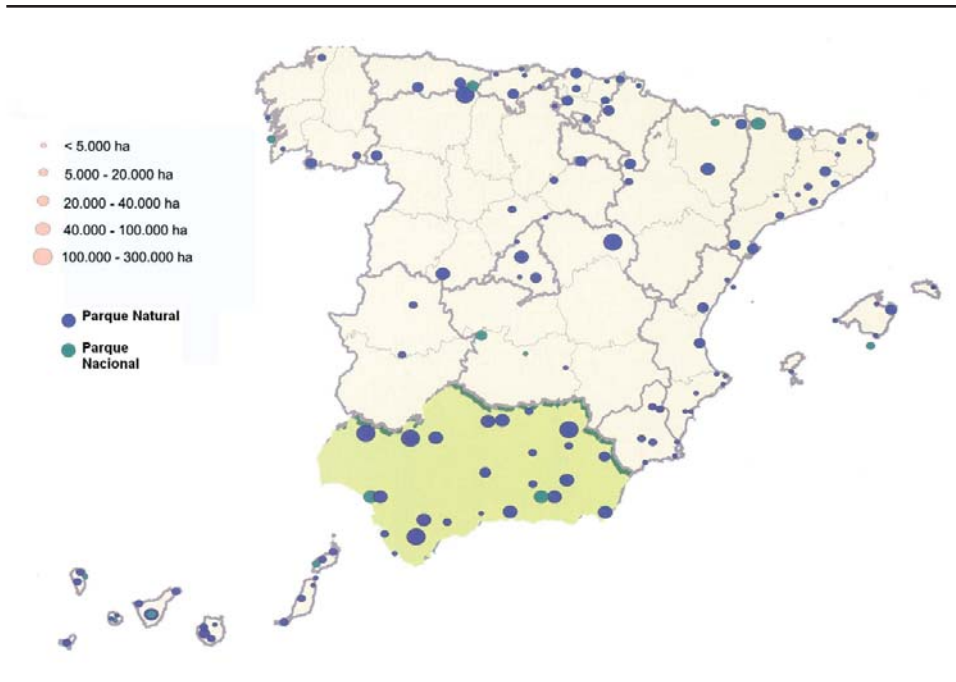
Figura 1. Parques Nacionales y Parques Naturales en España