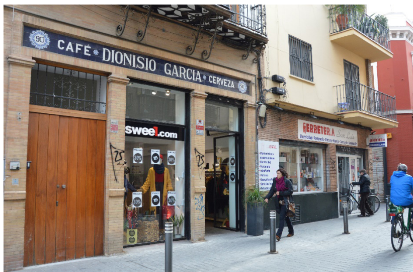
Figura 4. Vestigio de comercio tradicional (rótulo) en un nuevo establecimiento