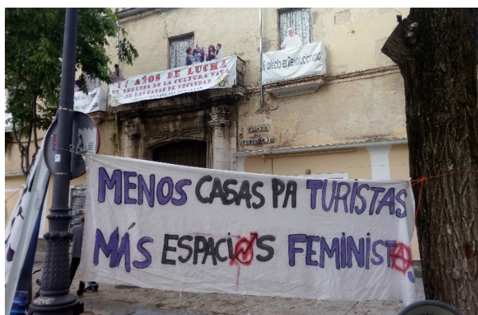
Figura 6. Pancarta de «La Revo» colgada en la plaza del Pumarejo el día de su desalojo (21 de abril de 2018)

Respecto a las vivencias afectivas, hay dos posiciones diferenciadas en los entrevistados: el cambio según los vecinos desplazados y según los todavía residentes en la zona. Un vecino y activista comenta que «la presión más cercana que siento es que tarde o temprano me va a llegar la hora de irme, sin contar con el malestar por tener amistades que se han tenido que ir forzosamente». Este y otros entrevistados mencionan emociones como el miedo o la incertidumbre provocados por la pérdida de vínculos sociales, estando aquellas detrás de prácticas espaciales y de resistencia. Así, en San Luis, esa construcción de geografías cotidianas se ha traducido en alianzas estratégicas, tanto en «La Revo» como en la casa-palacio del Pumarejo, donde colectivos de mujeres feministas e identidades disidentes han desarrollado prácticas potencialmente emancipatorias de cuidados comunitarios y cooperación, desde una conciencia espacial compartida 9 . No es casual que tales colectivos consideren su existencia antagónica al crecimiento del turismo (Figura 6).