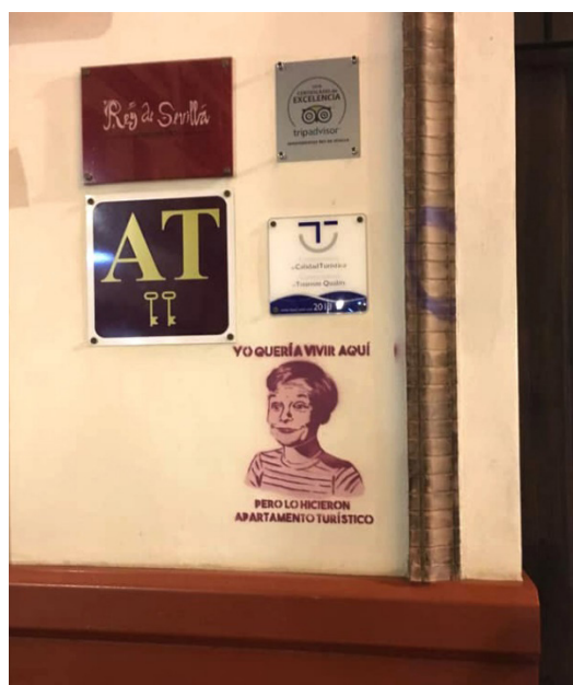
Figura 5. Pintada en el entorno de la iglesia de San Gil

Fuente: de los autores. Noviembre de 2018.