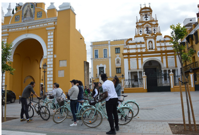
Figura 3. Visita turística frente al arco y la basílica de la Macarena

Fuente: de los autores. Noviembre de 2019.